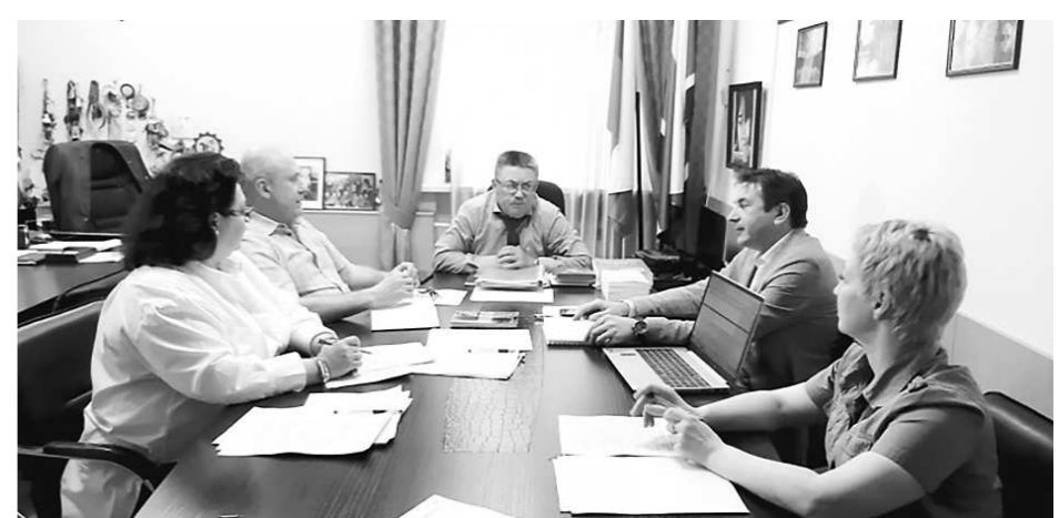
Фото 4. Заседание Экспертного совета