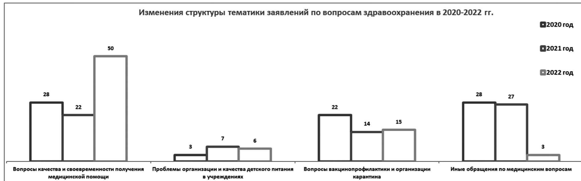
Рис. 17. Структура заявлений по вопросам здравоохранения в 2020-2022 гг.