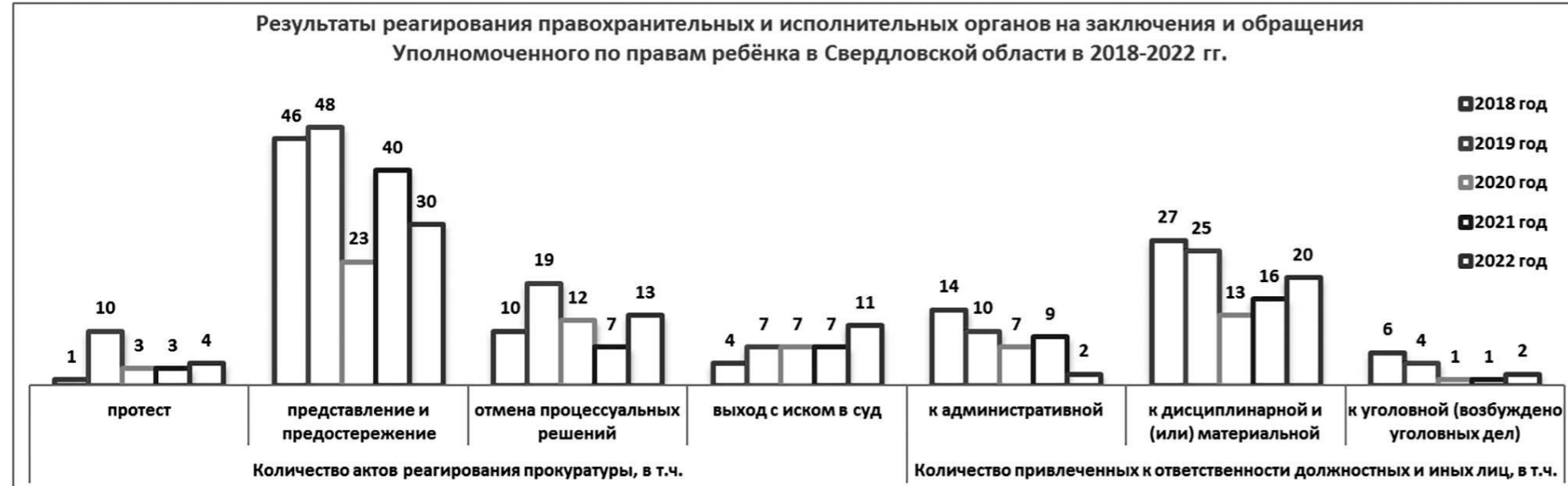
Рис. 19. Результаты реагирования на заключения Уполномоченного в 2018-2022 гг.