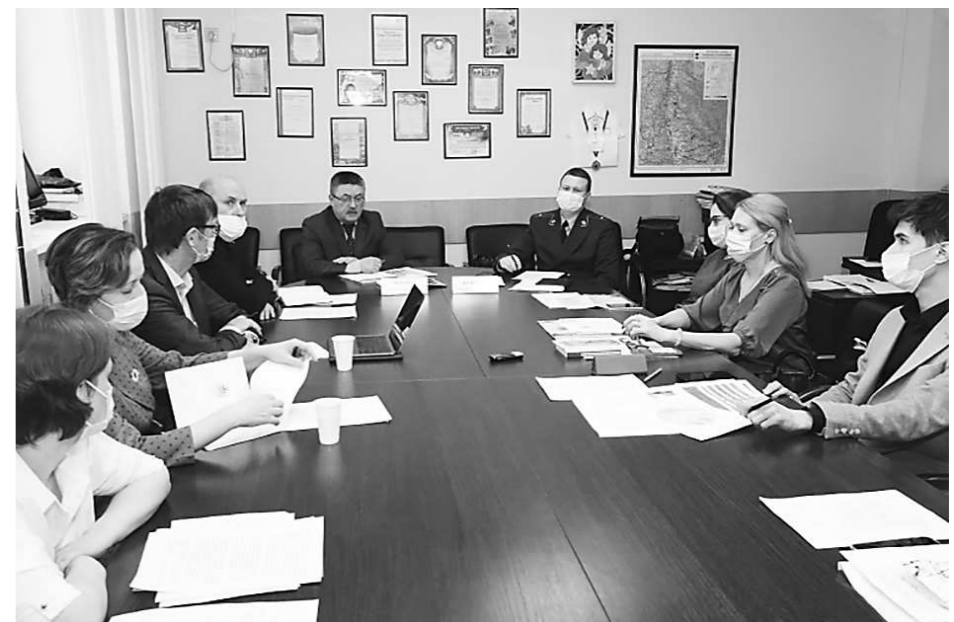
Фото 1. Заседание МРГ по профилактике суицидов

Наряду с возмещением имущественного ущерба и компенсацией морального вреда не менее важным способом восстановления нарушенных преступлением прав являются реабилитационные мероприятия в отношении несовершеннолетних потерпевших. Однако их проведение организуется территориальными комиссиями также не всегда.