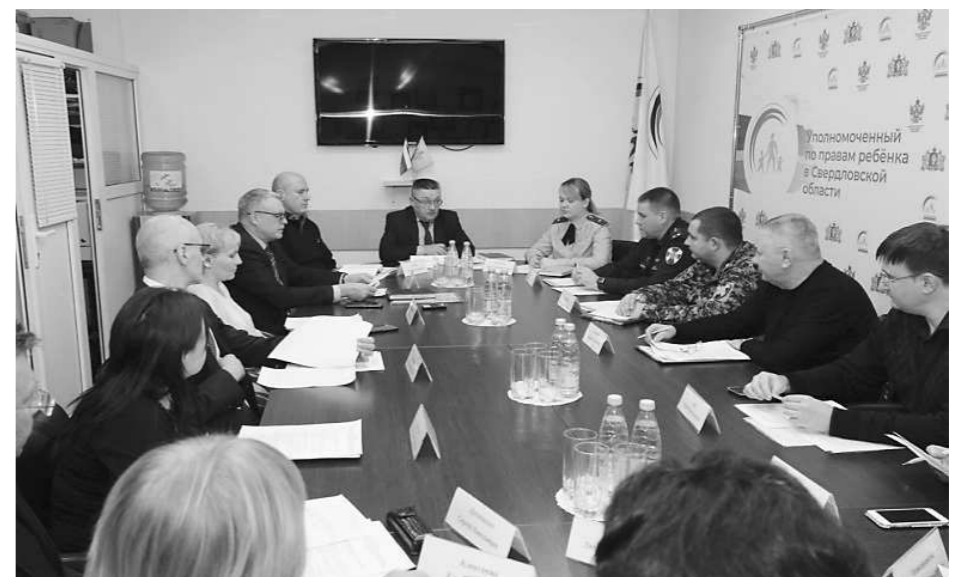
Фото 3. Заседание МРГ по вопросам безопасности в образовательных организациях