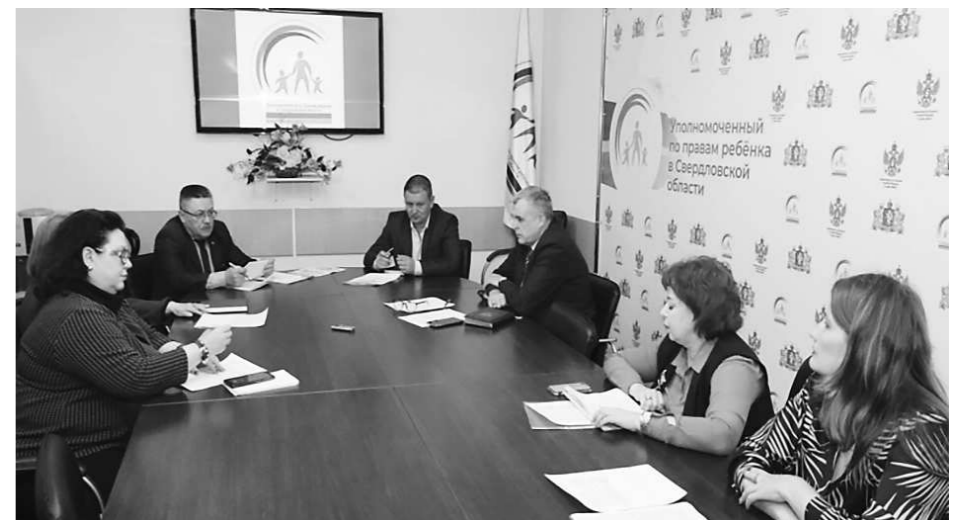
Фото 2. Заседание МРГ по профилактике гибели детей от немедицинских причин