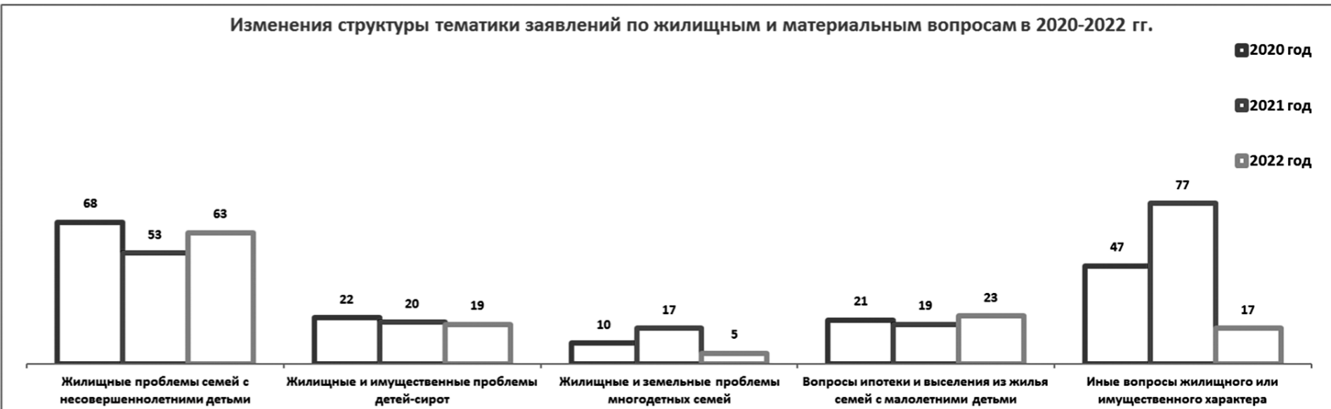
Рис. 15. Структура обращений по жилищным и имущественным вопросам в 2020-2022 гг.