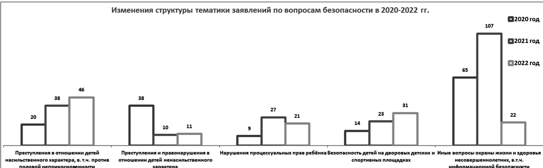
Рис. 16. Структура заявлений по вопросам безопасности в 2020-2022 гг.