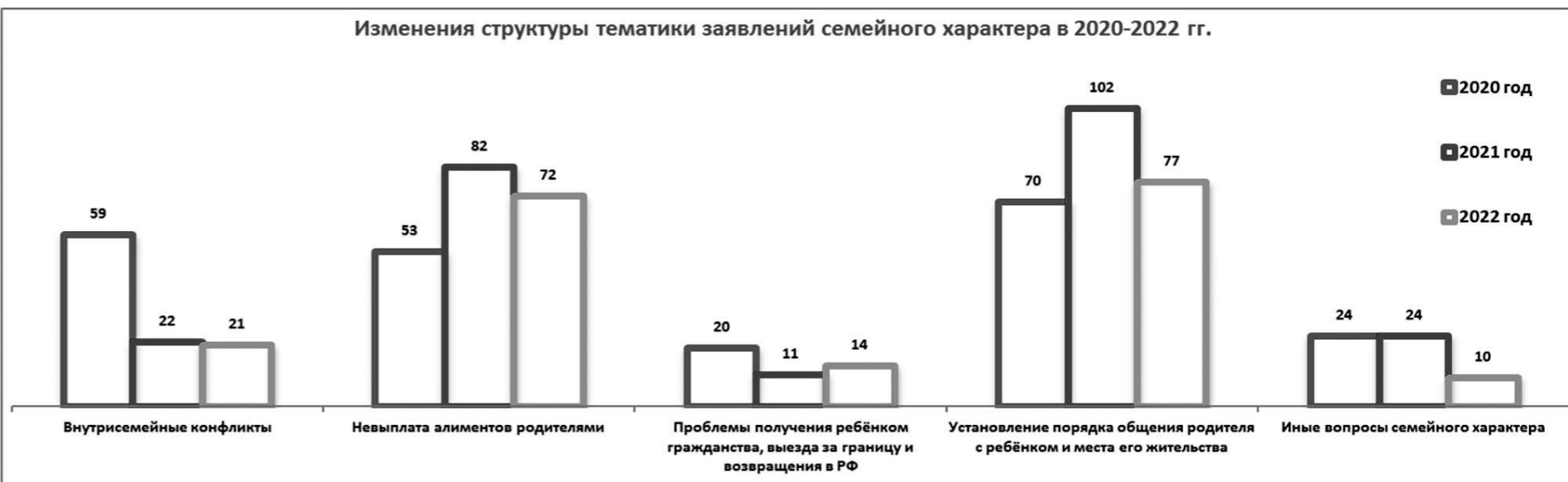
Рис. 14. Структура заявлений по семейным вопросам в 2020-2022 гг.