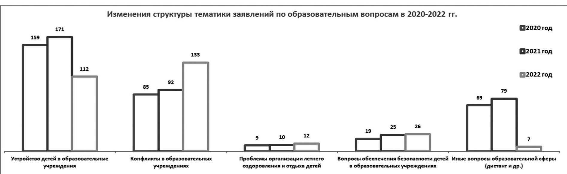
Рис. 13. Структура заявлений по образовательным вопросам в 2020-2022 гг.