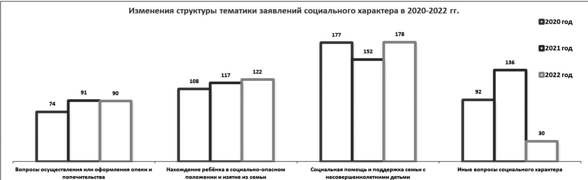
Рис. 12. Структура заявлений по социальным вопросам в 2020-2022 гг.