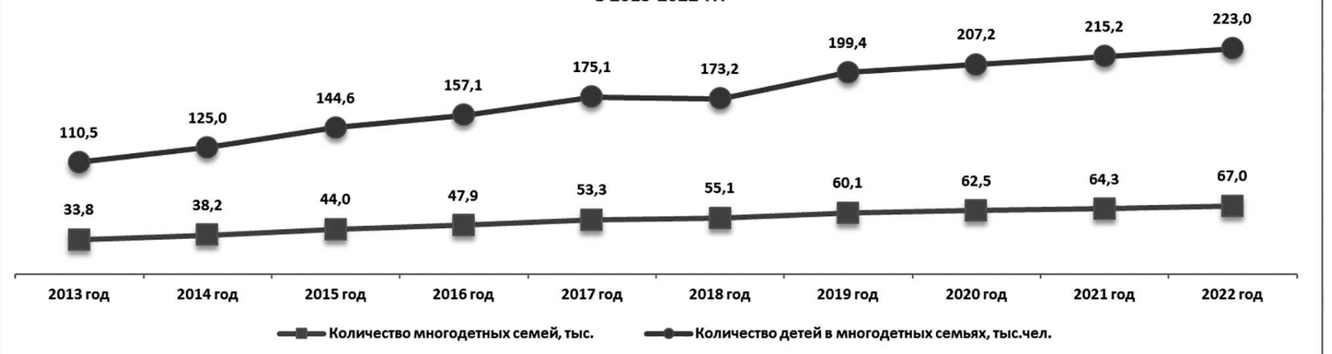
Рис. 3. Динамика роста количества многодетных семей и детей в них.