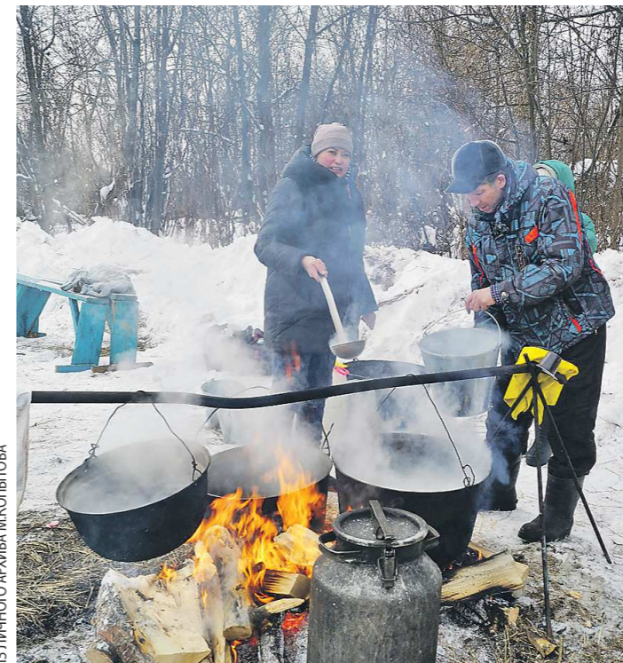
Уха из разных видов рыбы вышла наваристой. На морозе – самое то!

Открытое акционерное общество «Российские железные дороги» в лице Свердловской железной дороги - филиала ОАО «РЖД» проводит аукцион № 23/1020/П/БОЦ/Э/СВЕРД на право заключения договора купли-продажи здания служебно-технического, литер А1, общей площадью 111,7 кв. м, с кадастровым номером 59:11:0080000:136, расположенного по адресу: Пермский край, г. Чусовой, разъезд Веренинский, 107-й км, ПК 9+25 м.