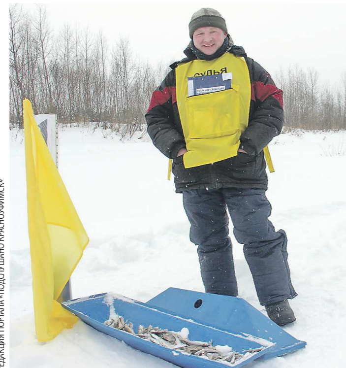
Улов у ног судьи. На удочку попались ерш, окунь, щегля, хариус...