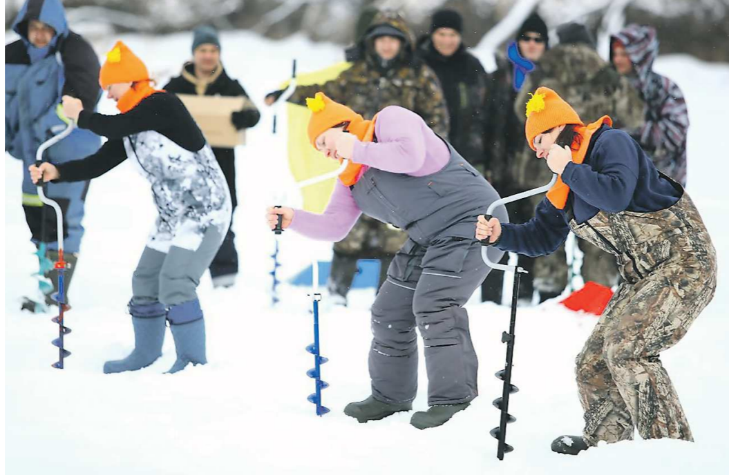
Женская сборная «Задорные рыбачки» на скорость сверлят лунки во льду

235 поклонников рыбалки из разных уголков Свердловской области приняли участие в соревнованиях по подледному лову рыбы в селе Рахмангулово (Красноуфимский район). Солнечным морозным утром с удочками наперевес они вышли на реку Уфу и, пожелав друг другу «ни хвоста, ни чешуи», под ружейный залп судейской бригады начали бурить лунки. В подледном лове наряду с мужчинами составились женщины и даже дети. Кто и сколько наловил, выяснила «ОГ».