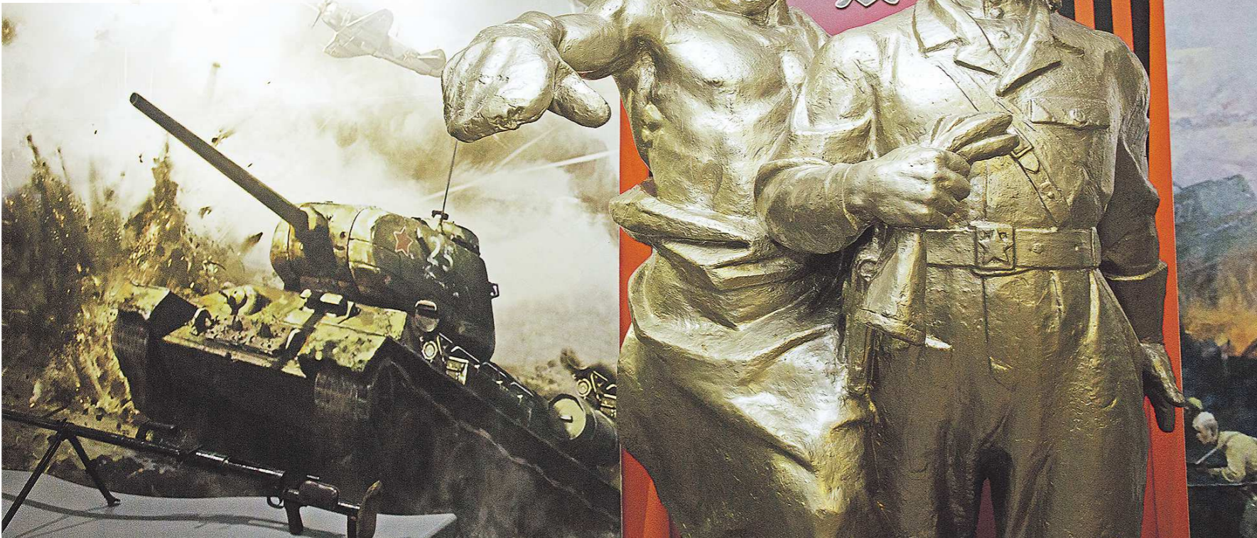
УДТК был создан в кратчайшие сроки за счет безвозмездного сверхурочного труда рабочих и личных сбережений жителей региона. Всего было собрано свыше 70 млн рублей