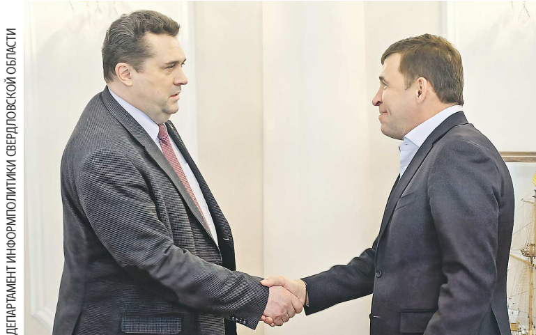
Евгений Куйвашев (справа) и Владимир Соловьёв отметили большой вклад свердловских журналистов в развитие гражданского общества

«Мы готовим регулярный рейтинг наших отделений, и отделение в Свердловской области — всегда в двадцатке лучших. Мы всегда приводим примеры, в том числе как сделан в Свердловской области Дом журналистов. Благодарю вас за поддержку Домжур-