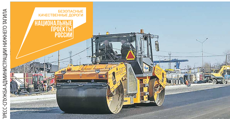
С 2019 года в Нижнем Тагиле благодаря нацпроекту «Безопасные качественные дороги» отремонтировано почти 90 километров автодорог

В 2023 году планируется восстановить пять дорожных участков по улицам Фрунзе, Тагилстроевской, Мира, а также на Чер-