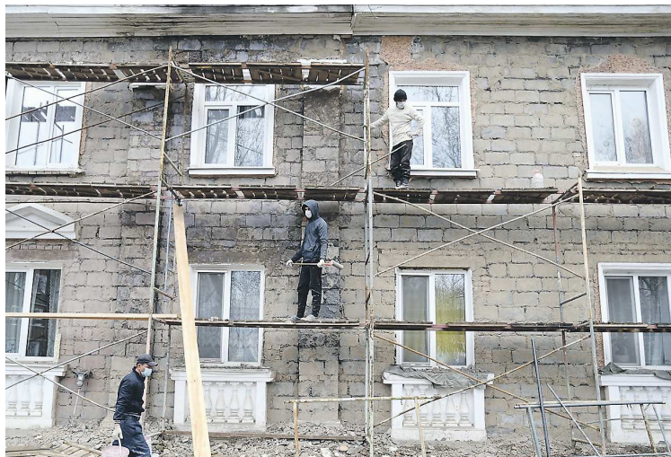
В перечень ремонтных работ входит восстановление фасада дома, замена кровли, внутренних коммуникаций, лифтов