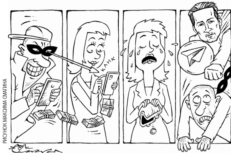
РИСУНОК МАКСИМА СМЕРГИНА

Пользователи Telegram все чаще жалуются на взломы аккаунтов. В основном хакеры делают это через отправку сообщений со ссылками на фишинговые сайты, где и происходит кража персональных данных. По данным киберэкспертов, за последний год количество фишинговых атак в мессенджерах выросло на 800 процентов. Чем опасен для пользователя взлом аккаунта в Telegram, какими данными могут завладеть хакеры и можно ли обезопасить себя от кибератаки – разбиралась «ОГ».