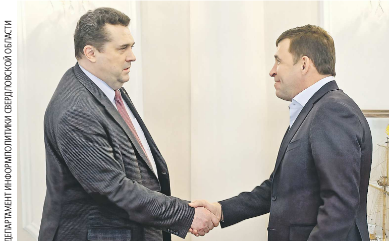
Евгений Куйвашев (справа) и Владимир Соловьёв отметили большой вклад свердловских журналистов в развитие гражданского общества

«Мы готовим регулярный рейтинг наших отделений, и отделение в Свердловской области — всегда в двадцатке лучших. Мы всегда приводим примеры, в том числе как сделан в Свердловской области Дом журналистов. Благодарю вас за поддержку Домжур-