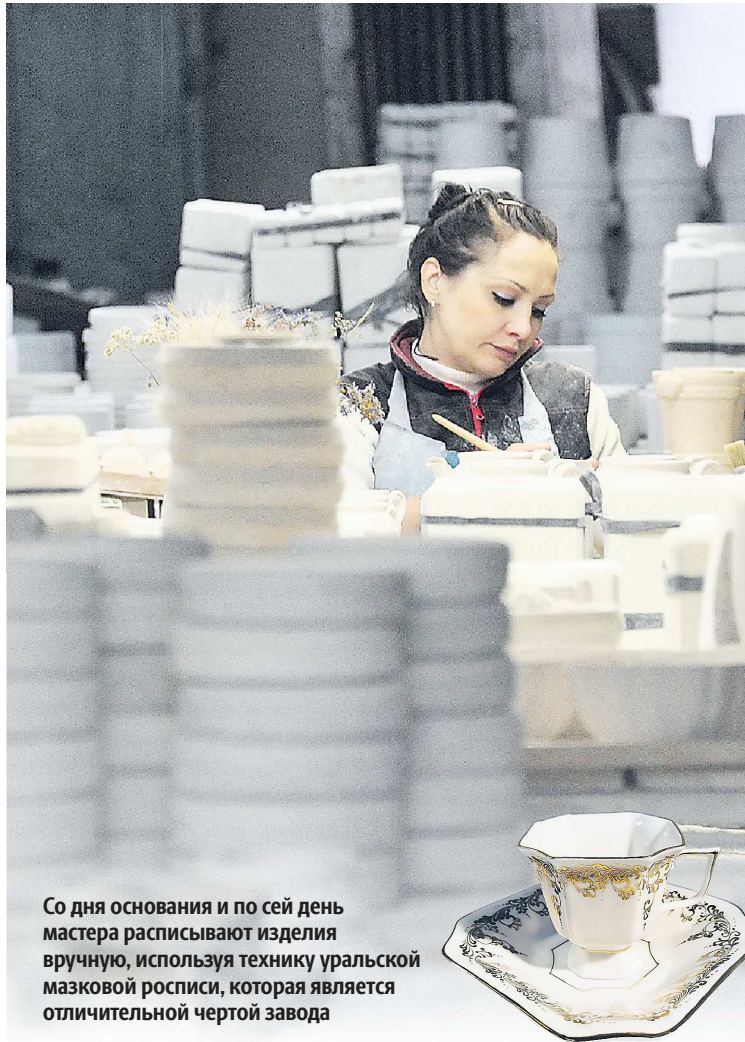
Со дня основания и по сей день мастера расписывают изделия вручную, используя технику уральской мазковой росписи, которая является отличительной чертой завода

Второй этап пройдет в марте – это главная стадия лаборатории, во время которой будут созданы образцы новой продук-