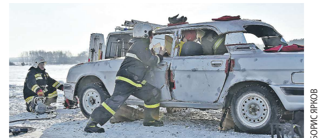
По легенде учений пассажирский автобус столкнулся с автомобилем