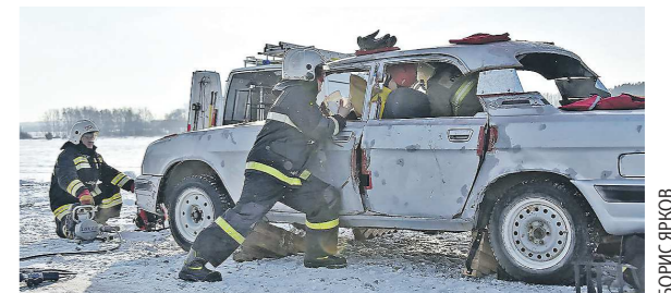
По легенде учений пассажирский автобус столкнулся с автомобилем