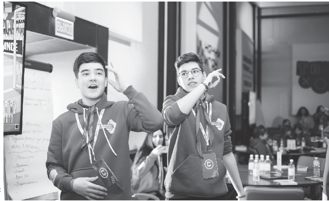
Эмоции на форуме были через край

Итогом работы форума стало формирование линейки проектов «Движения первых», которые школьники и студенты России смогут использо-