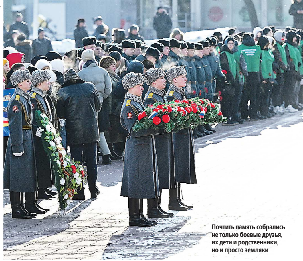
Почтить память собрались не только боевые друзья, их дети и родственники, но и просто земляки