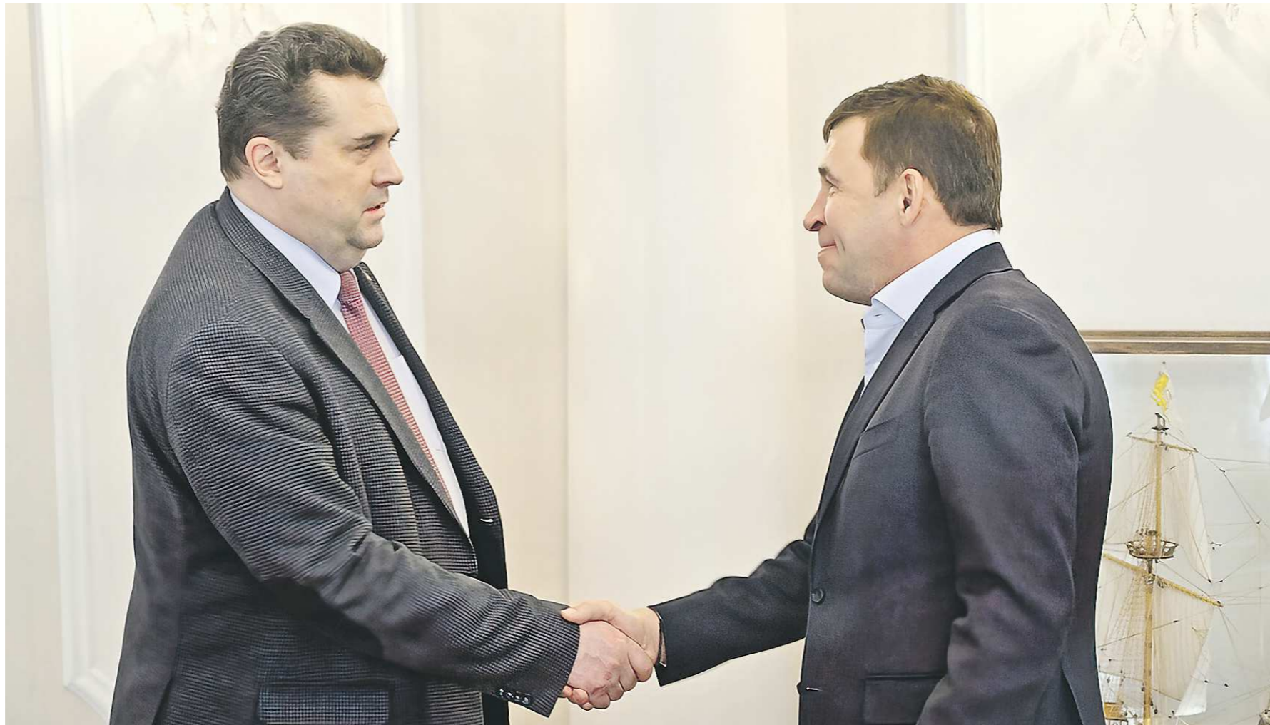
Евгений Куйвашев (справа) и Владимир Соловьёв отметили большой вклад свердловских журналистов в развитие гражданского общества

По данным Роскомнадзора, сейчас на Среднем Урале работает около тысячи средств массовой информации. Многие представите-