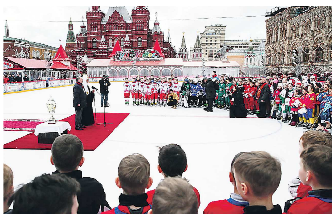
В церемонии открытия турнира непременно участвует глава Русской православной церкви Патриарх Кирилл

Вчера, 15 февраля, в Москве стартовал финальный этап Всероссийского детского турнира по хоккею с мячом на призы Святейшего Патриарха Московского и всея Руси. Среди участников соревнований – две команды из Свердловской области: карпинский «Спутник» (мальчики) и «Факел-11» из Богдановича (девочки).