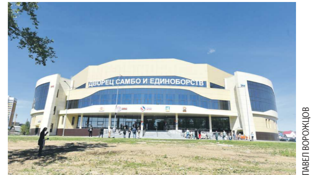
В прошлом году Верхняя Пышма принимала взрослый чемпионат России, в этом принимает юниорское первенство страны

Дворец самбо и единоборств в Верхней Пышме, начавший свою работу 1 июня 2022 года, принимает у себя первые масштабные соревнования. В новом спортивном объекте проходит первенство России по самбо среди юниоров и юниорок (до 20 лет).