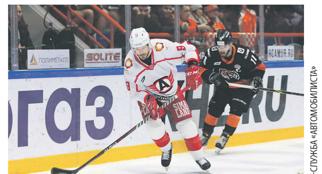
«Автомобилист» впервые в сезоне уступил «Амуру»

Хоккейный клуб «Автомобилист» потерпел поражение в очередном матче регулярного чемпионата КХЛ. «Шоферы» в Хабаровске уступили «Амуру» – 2:3.