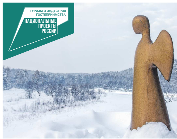
С каждым годом туристические маршруты по родному краю становятся все популярнее

День памяти о россиянах, исполнявших служебный долг за пределами Отечества