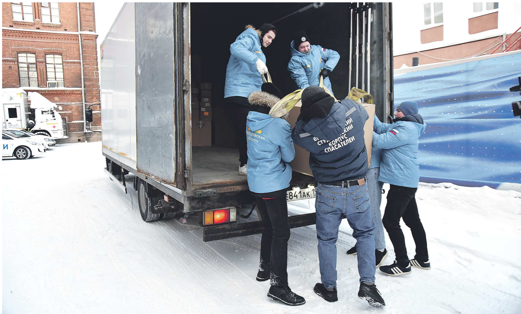
Самым тяжелым грузом в отправляемой партии стали дизель-генераторы

Отдельно, аккуратно стопкой укладываются картонные коробки, на каждой из ко-