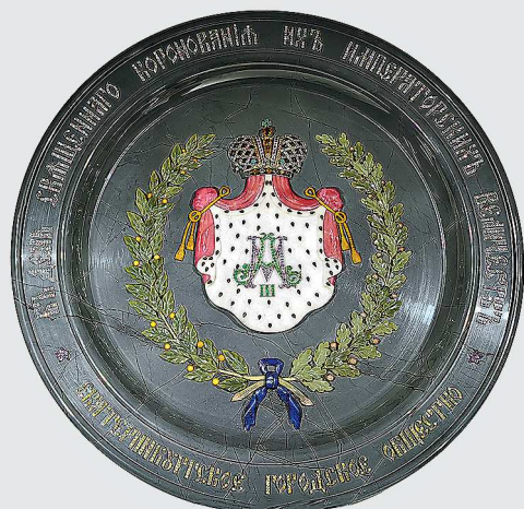
Подносное блюдо – подарок Александру III. Мастерская и магазин А. Кочнева, Екатеринбург, 1882 г. Государственный Эрмитаж

Нынешние Дни Эрмитажа – это три выставки на разных площадках. Продолжение читайте в ближайших номерах «ОГ»