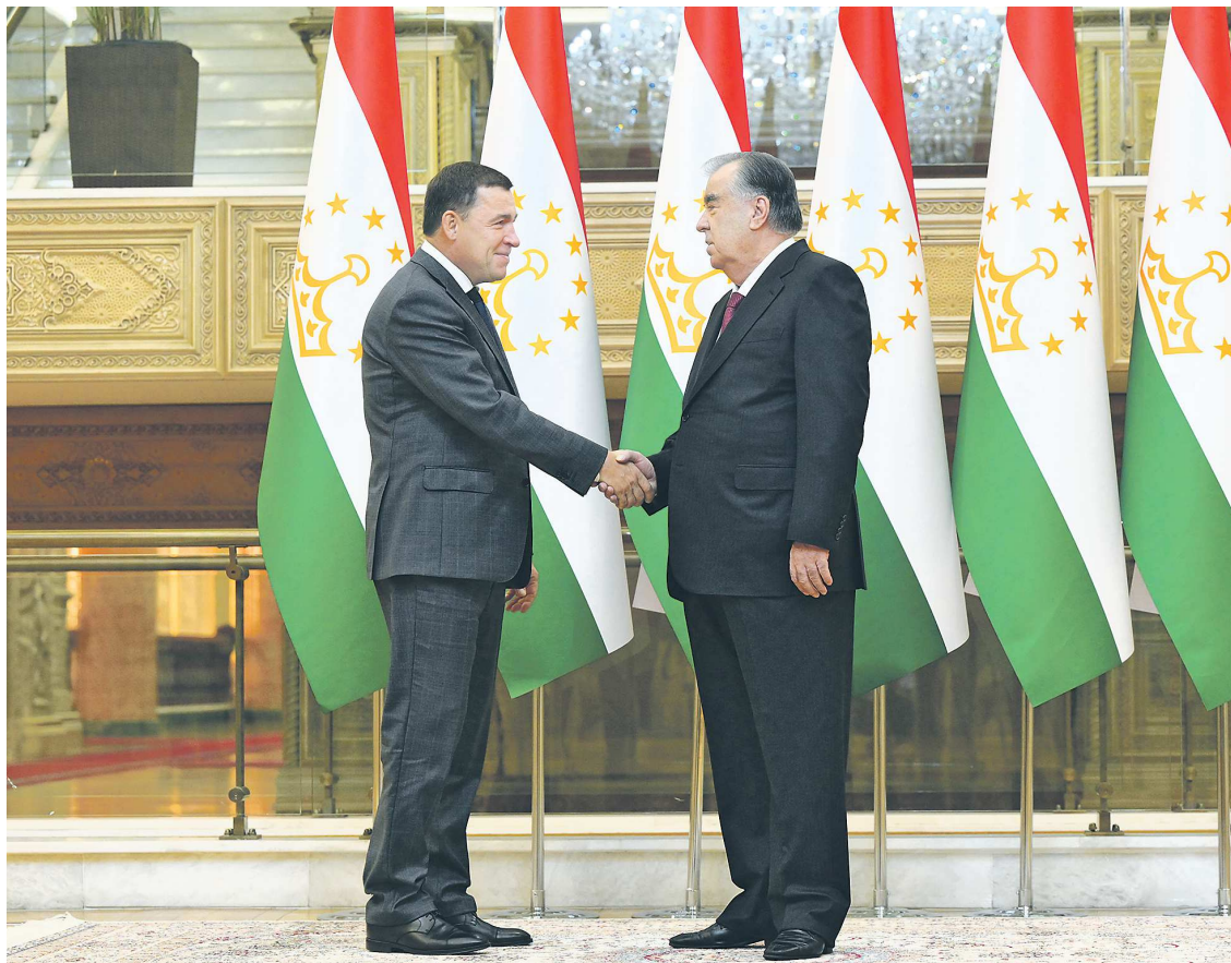
По итогам переговоров губернатора Евгения Куйвашева с президентом Таджикистана Эмомали Рахмоном планируется подписание ряда соглашений с регионами республики