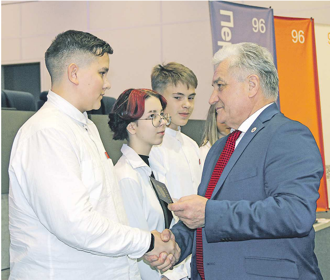
Крепкое рукопожатие министра образования и молодежной политики Свердловской области Юрия Биктуганова запомнится на всю жизнь