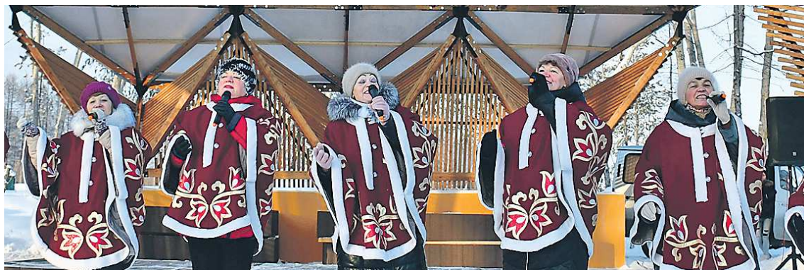
Открытие набережной стало настоящим праздником, который сопровождался выступлением творческих коллективов города

Как сообщает местная газета «Заря Урала», масштабная работа по благоустройству прибрежной территории реки Турья шла еще с 2016 года, когда началась реконструкция Парка влюбленных. После этого облагородили набережную со стороны улицы Серова, а затем территорию в Заречном районе по улице Рюмина. Завершающим стал проект по реконструкции правого берега главной водной артерии Краснотурьинска – сектора у Краснотурьинского политехникума.