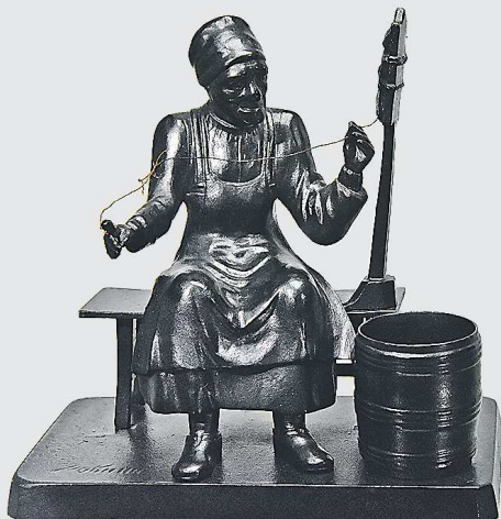
Спичечница «Старуха с прялкой», Каслинский чугуноплавильный и железоделательный завод, отливка. 1913 г.