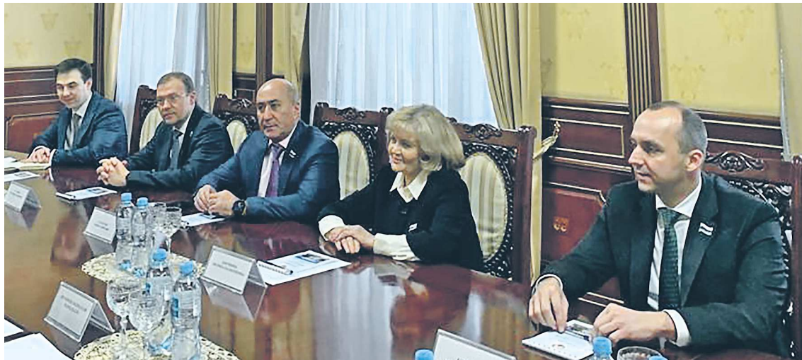
Председатель Законодательного Собрания Людмила Бабушкина во время официальной встречи с первым заместителем председателя Маджлиси намояндагон Маджлиси Оли (парламента) Республики Таджикистан Махмадали Ватанзода

Президент Таджикистана Эмомали Рахмон отметил, что сотрудничество на уровне регио-