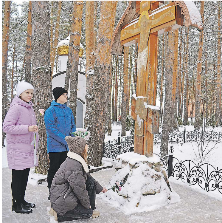
Подростки возлагают цветы к памятному месту

В музее гости попадают в комнаты, где молилась Елизавета Фёдоровна, а князь Сергей Михайлович читал книги. В одной из них экскурсовод предложила