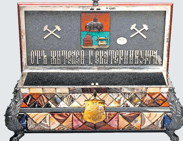
Открытая шкатулка подносная. Императорская Екатеринбургская гранильная фабрика, 1891 г. Государственный Эрмитаж