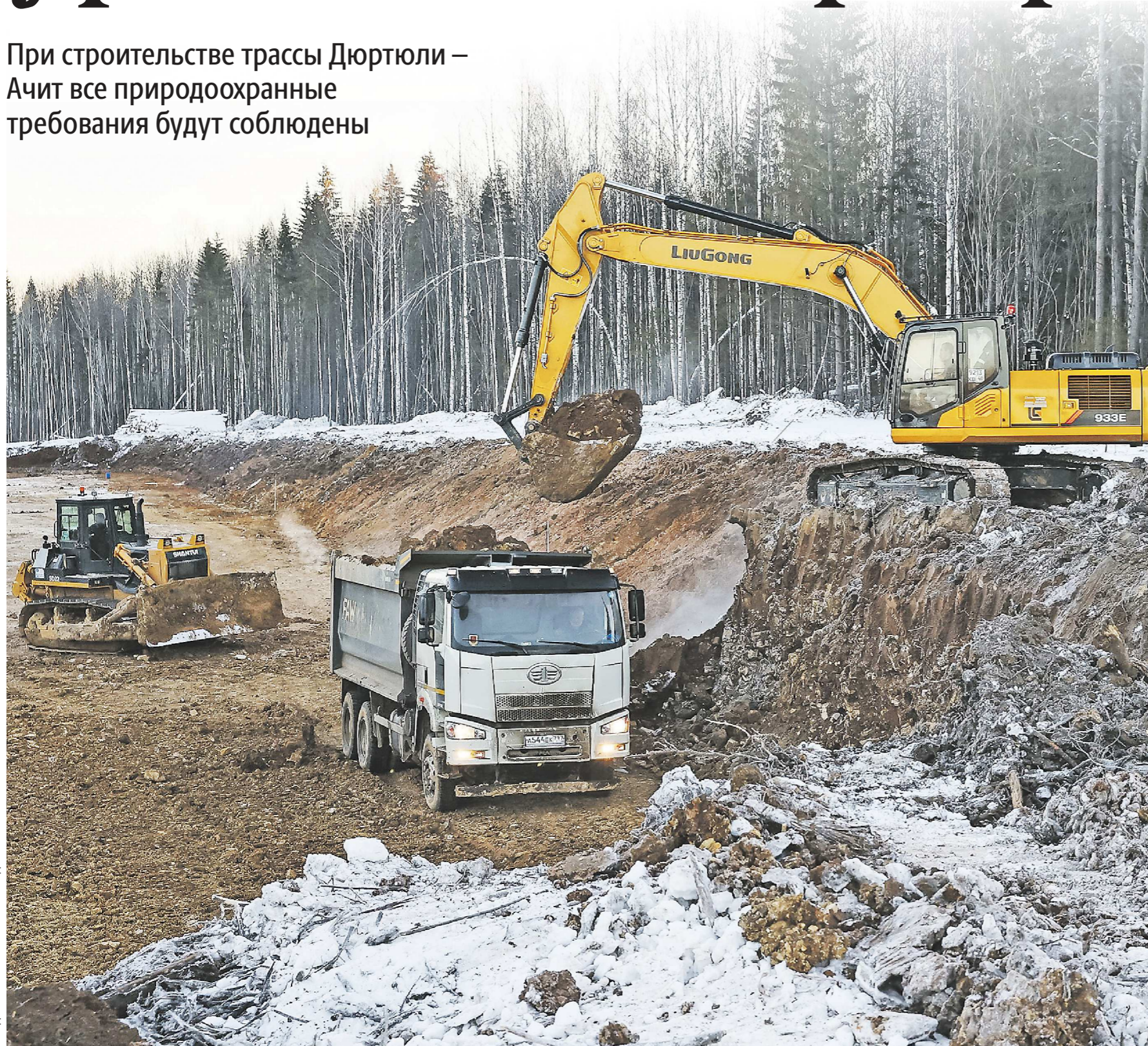
Сдать готовую скоростную федеральную трассу Дюртюли – Ачит строители должны уже к концу 2024 года

При строительстве трассы Дюртюли – Ачит все природоохранные требования будут соблюдены