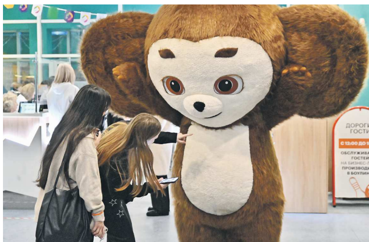
Талисманом фестиваля 2024 года стал Чебурашка – один из главных героев знаменитой книжки Эдуарда Успенского. Как говорят организаторы, выбор героя не случаен: Чебурашка олицетворяет основные ценности Всемирного фестиваля молодёжи – дружелюбие и взаимное уважение

По словам Владимира Путина, на участие во Всемирном фестивале молодёжи подано более 250 тыс. заявок из 183 стран. «Такой впечатляющий масштаб говорит о том, что нет силы выше дружбы. Об огромном, искреннем интересе к России, к нашей истории», – отметил глава государства.