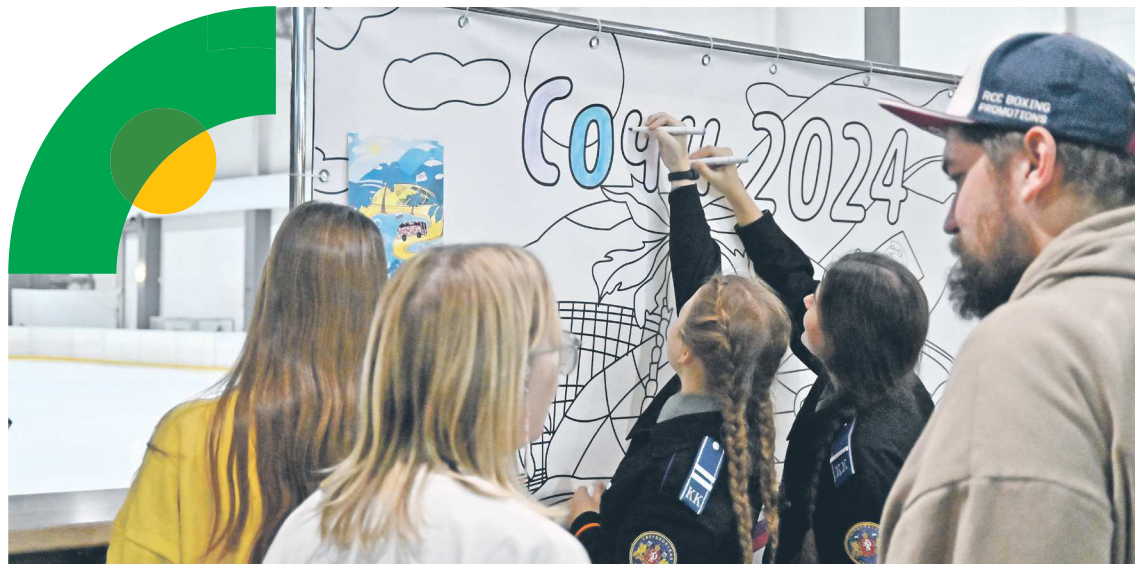
В так называемой Зоне вдохновения участники мероприятия добавили красок в картину Сочи