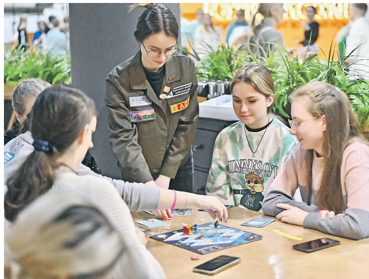
Для участников мероприятия провели несколько мастер-классов, где ребят научили делать своими руками простые, но красивые сувениры