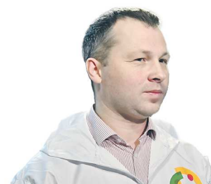
Денис ПРОТАСОВ, заместитель министра образования и молодежной политики Свердловской области, директор департамента молодежной политики

Из распоряжения губернатора Свердловской области