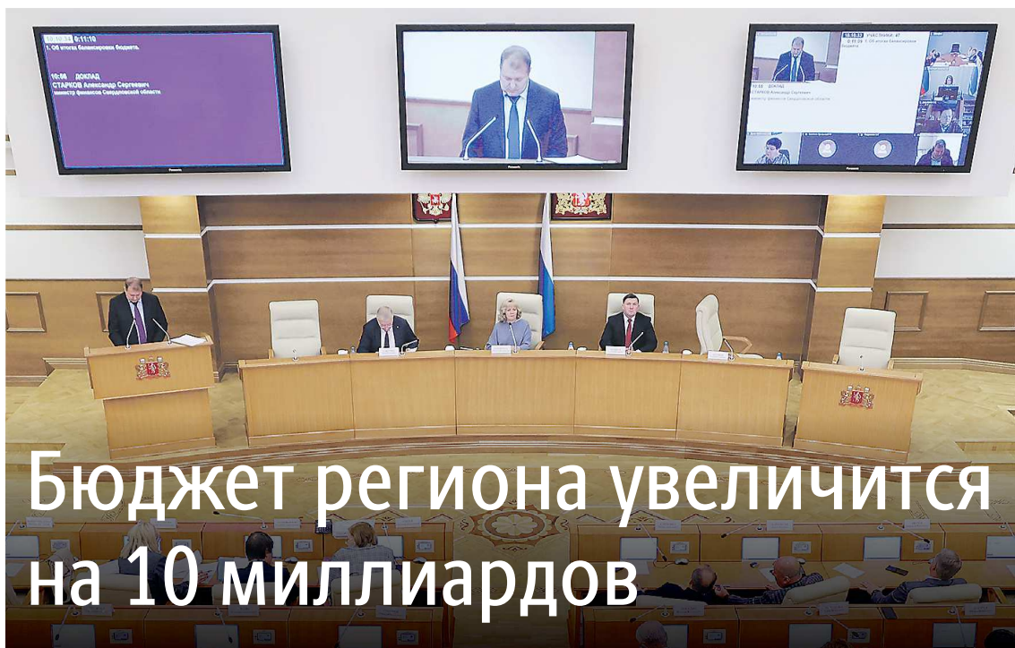
ПРЕСС-СЛУЖБА ЗАКОНОДАТЕЛЬНОГО СОБРАНИЯ