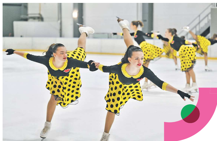
Перед тем, как будущие участники Всемирного фестиваля сами вышли на лед «Луны», им показала свое мастерство свердловская команда по синхронному фигурному катанию

«Мы сделаем все, чтобы наша делегация была яркой и достойно представила Свердловскую область на Всемирном фестивале молодёжи-2024, а 80 иностранцев, которые приедут на региональную программу в Екатеринбург, узнали и полюбили наш регион. Всем участникам желаю удачи, пишите интересные эссе, делайте яркие видеоролики, и лучшие обязательно станут делегатами от нашего региона на фестивале.»