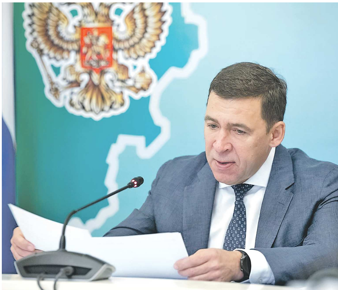
ДЕПАРТАМЕНТ ИНФОРМАТИКИ СВЕРДЛОВСКОЙ ОБЛАСТИ