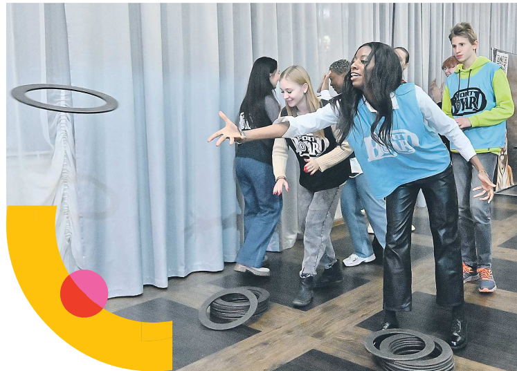
По мнению организаторов, приключенческая игра «Форт Боярд» отлично способствует формированию командного духа, так необходимого потенциальным делегатам фестиваля