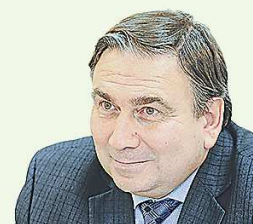
Николай СМИРНОВ, министр энергетики и ЖКХ Свердловской области

“ Губернатором Свердловской области еще в начале экологической реформы было принято решение о том, что в регионе мусоросжигающих заводов не будет. Экологические кластеры создаются в рамках реформы обращения с отходами в России, потому что к 2030 году регионы должны перейти к их разделному сбору. О необходимости сократить число свалок в России заявил в 2018 году в послании к парламенту Президент Российской Федерации Владимир Путин. Мы будем разъяснять, что это не свалка, а современное производство.