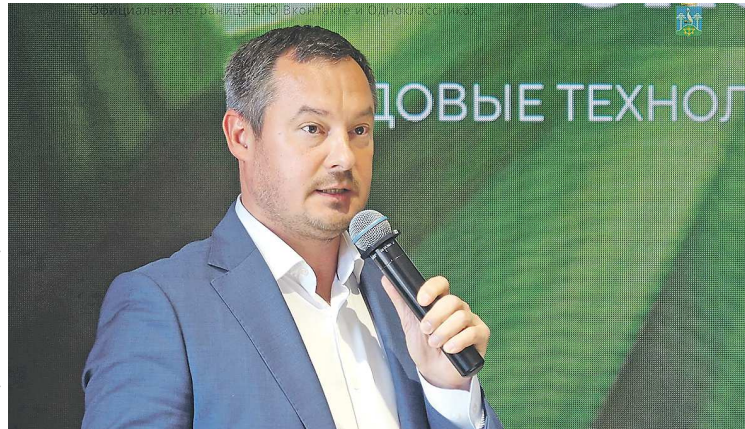
ОФИЦИАЛЬНАЯ СТРАНИЦА СЫСЕРТСКОГО ГО «В КОНТАКТЕ»

– Мы изучили информацию о Сысерти и ее главе, и она нас впечатлила. Небольшой промышленный городок, а поток туристов туда растет. Развивается креативный кластер. Взять хотя бы проект «Лето на заводе». Видна качественная работа над брендом территории. Мы считаем, что надо поощрять не только города-миллионники, и у Сысерти есть все шансы. К примеру, несколько лет назад мэром года