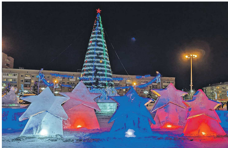
ИЗ АРХИВА АДМИНИСТРАЦИИ КАМЕНСКО-УРАЛЬСКОГО

В ледяных скульптурах изобразят самых известных героев Бажова – «Серебряное копытце», «Хозяюку Медной горы», «Данилу-мастера», «Огневушка-поскакушку», «Каменный цветок». Также создадут композицию «Дед Мороз и Снегурочка», блюдо-ловушку, входную группу. Скульптуры будут изготовлены из блоков речного льда. Сто-