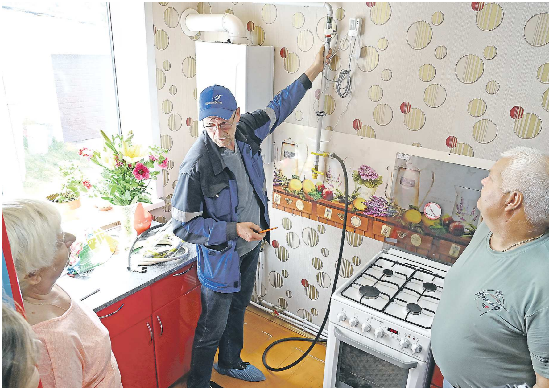
За год программой социальной догазификации заинтересовались более 40 тысяч свердловчан, но далеко не все успели подготовить свои дома к подключению газа

Товарищи об этом и руководители газораспределительных компаний, участвующие в заседании. Они, в частности, сообщили, что по итогам 2022 года в число аутсайдеров с наименьшим процентом подключения вошли три муниципалитета: