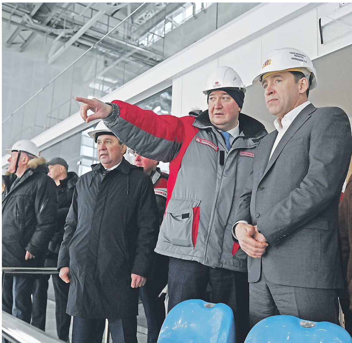
Расходы на социальную сферу в бюджете–2024 на 19 миллиардов рублей превысят уровень 2023 года

На сегодняшнем заседании депутаты Законодательного Собрания должны принять закон о бюджете в первом чтении.