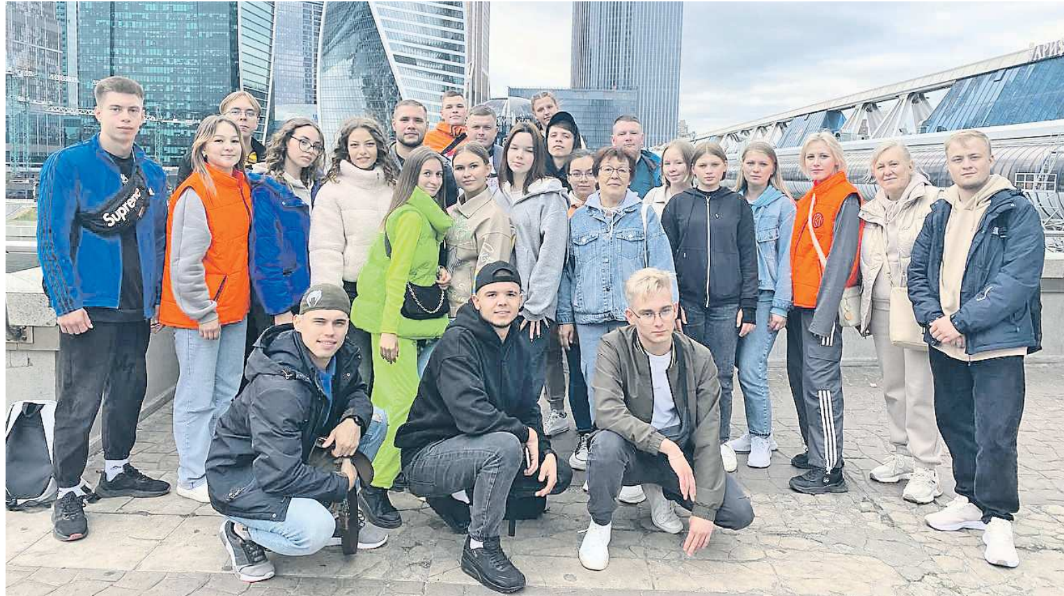
Группа победителей конкурса отдыхала в Коктебеле с 9 по 23 сентября 2023 года

Для добровольцев, имеющих не менее 100 волонтер-часов в течение года, предшествующего году участия в конкурсе, есть возможность побороться за приз в номинации «Лучший волонтер». Победителями в номинации становятся члены добро-