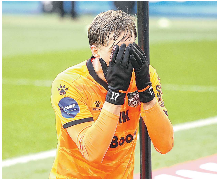
«Урал» не побеждает в чемпионате России на протяжении десяти матчей