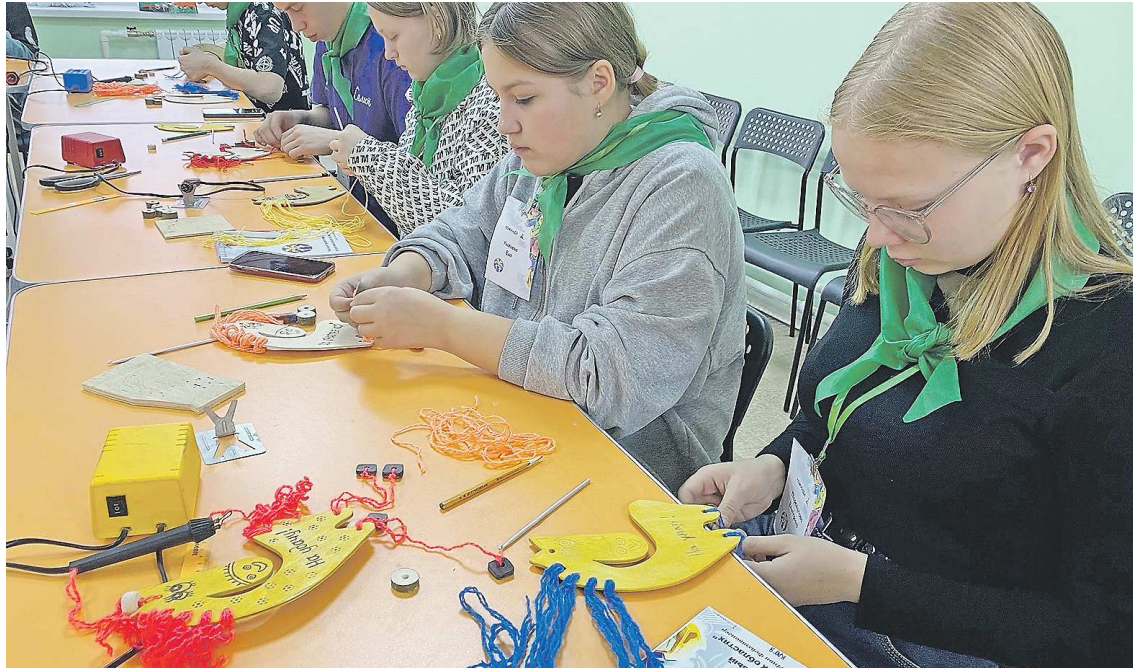
В первой осенней смене для подростков проходили различные мастер-классы, в том числе по изготовлению сувениров-оберегов на память о «Салюте»