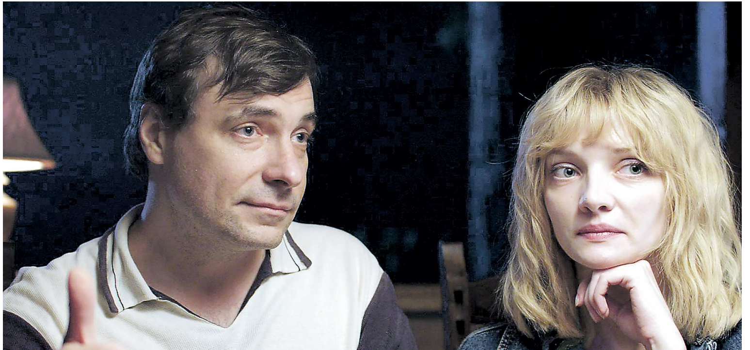
Кадр из нового фильма Александра Велединского «1993». Посмотрим, удастся ли картине обойти в зрительской любви «Географа»

– Потому что я – участник этих событий. 1 октября 1993 года мы начали учиться на высших курсах режиссеров и сценаристов. Поселились в общежитии ВГИКа. И услышали стрельбу. А от нас до Останкино было – ну вот как от Ельцин Центра