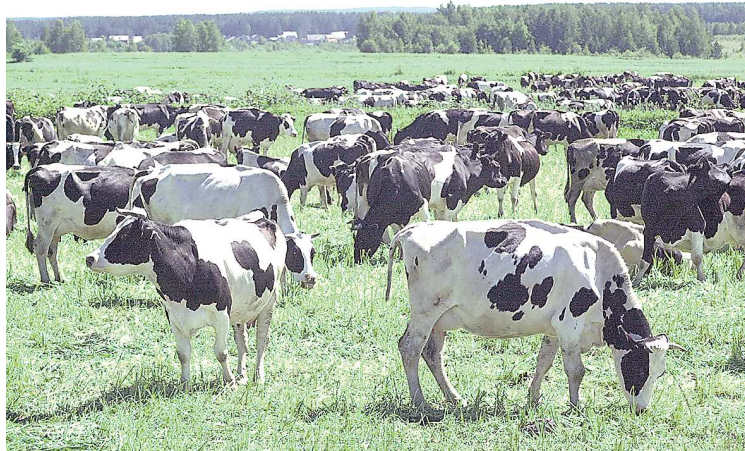
Свердловская область ежегодно наращивает объемы поставок сельхозпродукции в другие страны

– На аккредитацию ветеринарных лабораторий представляются субсидии из федерального бюджета. Свердловской области на эти цели за два года выделено 19,5 миллиона рублей, и уже шесть лабораторий проводят исследования аг-