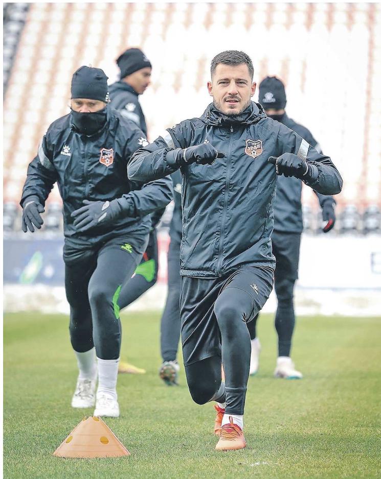
«Урал», несмотря на неудачи в чемпионате России, подошел к кубковому матчу с «Ростовом» в полной готовности

Очередной выезд «Урала» не стал исключением. Во вторник команда провела утреннюю тренировку, после чего отправилась в аэропорт и добра-