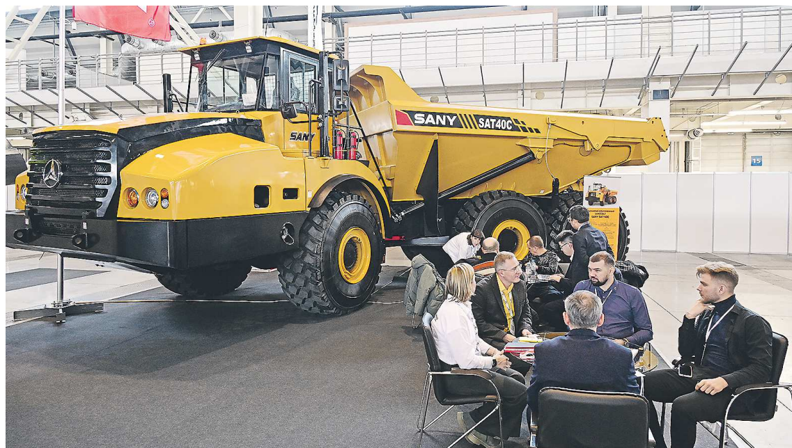
Выставка собрала 170 поставщиков и производителей оборудования из 57 городов России, Республики Беларусь и Китайской Народной Республики

Выставка «Рудник. Урал» проходит при поддержке правительства Свердловской области, Торгово-промышленной палаты РФ и ассоциации «Горнопромышленники России» и будет открыта до 27 октября.