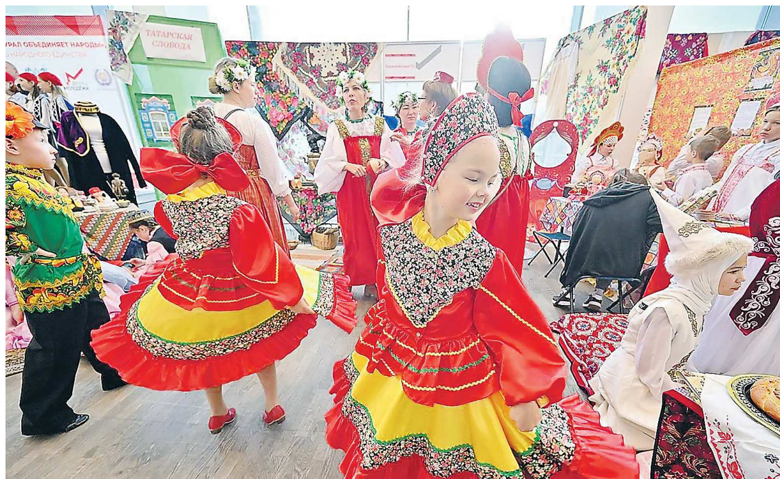
Коллектив из Березовского представил подворья сразу трех национальностей – татар, киргизов и русских

– Ребята сами со своим наставником-педагогом выбирают национальную культуру, о которой хотят узнать больше. В весенне-летний период они встречаются с представителями этой национальности: узна-