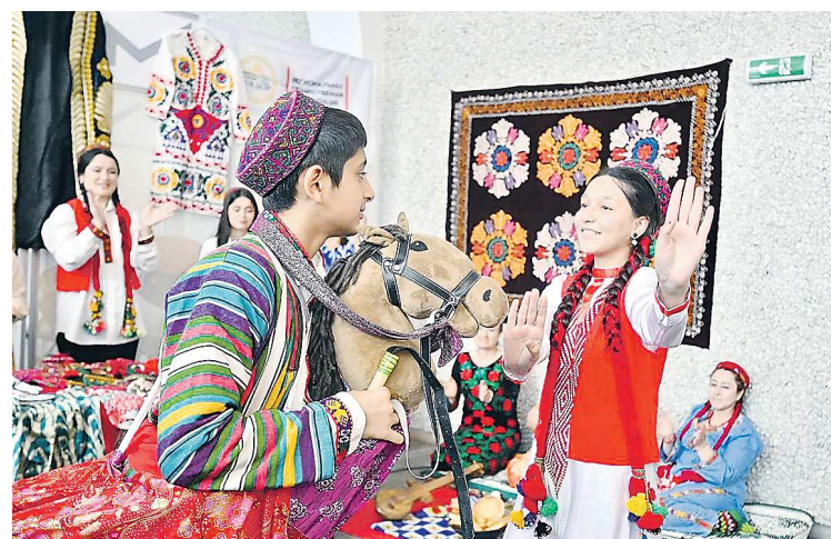
В номинации «Художественное оформление национального подворья» I место присуждено областной общественной организации «Таджикская диаспора «ДИДОР»