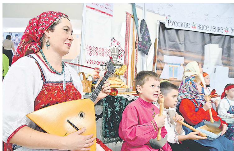
Детский сад № 524 из Екатеринбурга, занявший первое место в номинации «Визитная карточка», показал на выставке, каким было русское подворье на Урале

Фестиваль завершен, в коллективах начата подготовка к новому фестивалю. На Среднем Урале – более 160 национальностей: есть о ком узнать подробнее, а затем – рассказать другим.