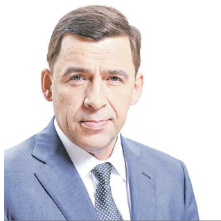
Губернатор Свердловской области