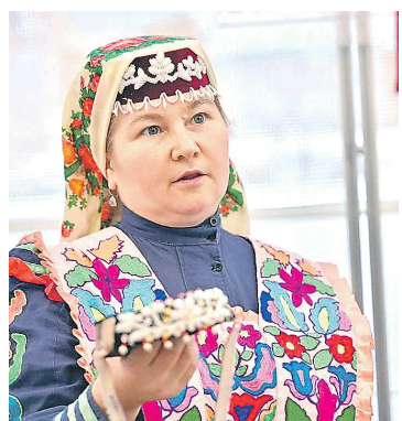
В номинации «Демонстрация национальных ремесел, традиций, обрядов» победитель – Центр «Наследие» из Нижних Серг, подготовивший мастер-класс по изготовлению татарских головных уборов