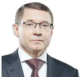
Полномочный представитель Президента России в Уральском федеральном округе

Благодарю работников автомобильного и городского пассажирского транспорта за добросовестный труд, весомый вклад в социально-экономическое развитие Свердловской области. Желаю крепкого здоровья, счастья, благополучия, дальнейших успехов в работе и доброго пути!