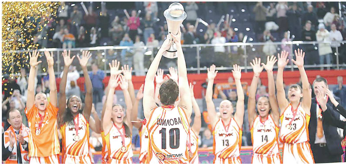
Баскетболистки «УГМК» с очередным Суперкубком России

«УГМК» – по-прежнему единственный в стране обладатель Суперкубка России по баскетболу