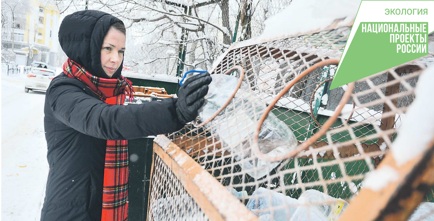
Сетчатые контейнеры для сбора пластика сегодня пользуются наибольшей популярностью у свердловчан

В ряде свердловских муниципалитетов внедрен так называемый дуальный сбор мусора, который предполагает разделение отходов на два вида – перерабатываемые и все остальные. Для этого установлены контейнеры двух типов: для вторичного, то есть годного к переработке сырья (стекла, пластика, макулатуры, пленки, картона) и отходов, которые нельзя переработать (остатки пищи, смешанная упаковка, использованные средства гигиены) – их вывозят на полигон. Контейнеры окрашены в разные цвета и промаркированы специальными наклейками. Как пояснили в областном МинЖКХ, такой подход способствует тому, что население уже на этапе выбрасывания мусора учится его сортировать. А чем больше отходов сразу пойдет на сор-