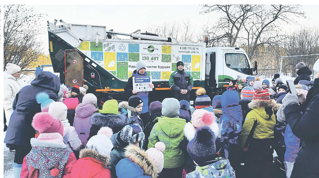
Регоператоры стараются наводить порядок на контейнерных площадках после вывоза мусора, а также проводят экологические акции – даже для самых маленьких