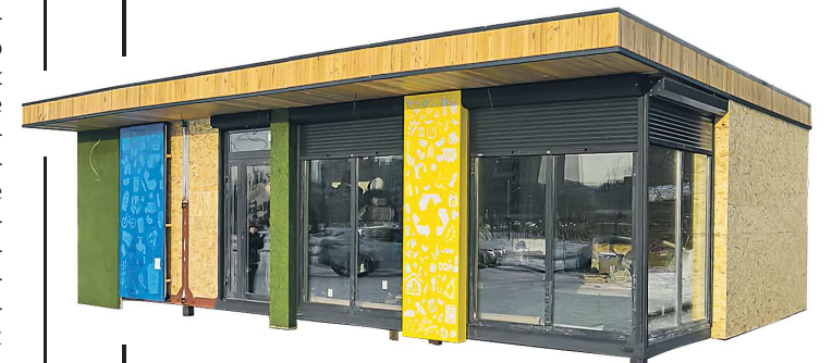
Так выглядит первый экододом в регионе, установленный в Нижнем Тагиле

Экододом – современный пункт приема вторсырья, куда можно принести до 10 видов отходов: текстиль, полиэтиленовые пакеты, пластик разных цветов, макулатуру, картон, пленку, металлические и алюминиевые банки. Здесь же эксперты будут обучать свердловчан правильной сортировке мусора, в том числе проводить разные экологические акции и мастер-классы.