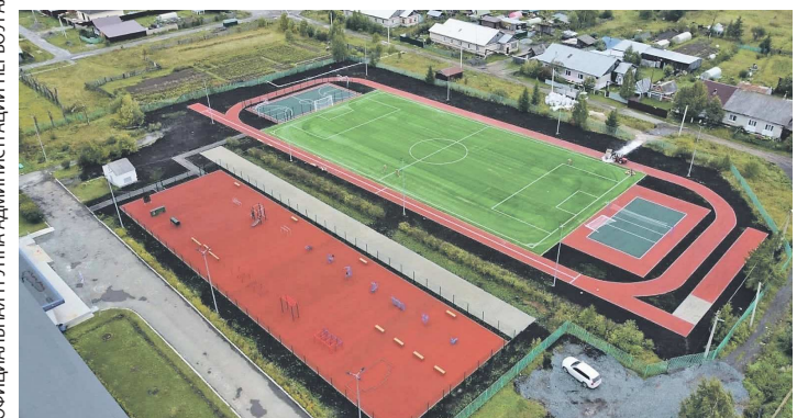
ОФИЦИАЛЬНАЯ ГРУППА АДМИНИСТРАЦИИ ПЕРВОУРАЛЬСКА

В Кузино под Первоуральском открыли современную спортивную площадку у школы № 36. Ее построили за лето. Стоимость объекта составила почти 20 млн рублей.