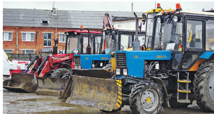
ИНФОРМАЦИОННЫЙ ПОРТАЛ «КСК66.РУ»

В первую очередь очистке подлежат дороги около образовательных учреждений, улицы, где проходят маршруты общественного транспорта, и гостевые маршруты. При этом во время экстренных случаев на город-