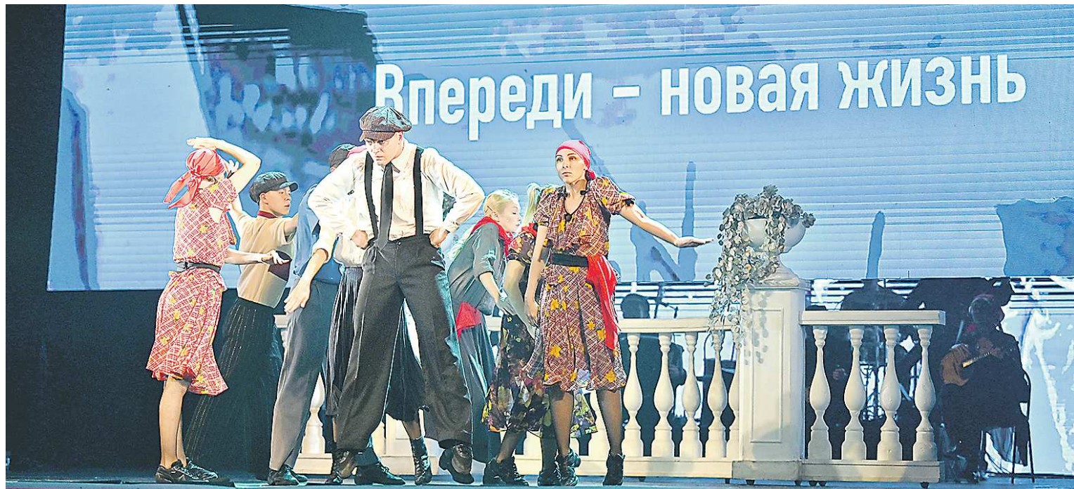
Один из эпизодов шоу «Театр в городе»: начало XX века, Свердловск – синемблузики, агитбригады, красные косынки и... рождение нового театра

У «ОГ» – свой проект: интервью с теми, кто занят в юбилейном шоу и чьи имена представляют сегодня театр-холдинг.