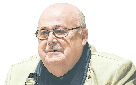
Александр КАЛЯГИН, председатель Союза театральных деятели Российской Федерации, народный артист России

« Несмотря на «легкий жанр», в театре не бывает легкомысленных спектаклей. Каждая постановка Музкома – это симфония смыслов, чувств и эмоций, это высочайшее мастерство и сложная драматургия, это важные вопросы, которые зритель задает самому себе после того, как закроется занавес. За это театр и любят не только жители Свердловской области, но и ценители искусства всей России.