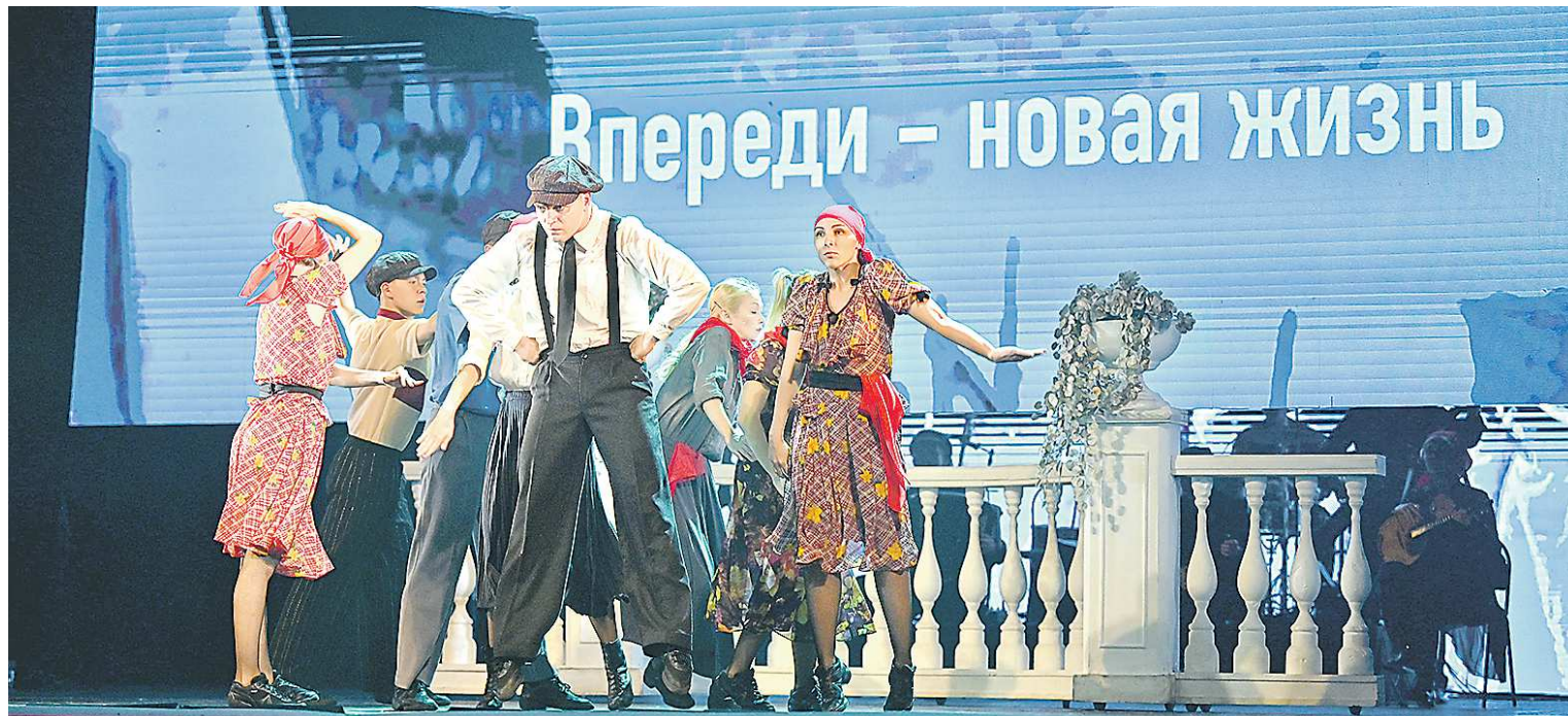
Один из эпизодов шоу «Театр в городе»: начало XX века, Свердловск – синемблужники, агитбригады, красные косынки и... рождение нового театра

У «ОГ» – свой проект: интервью с теми, кто занят в юбилейном шоу и чьи имена представляют сегодня театр-холдинг.