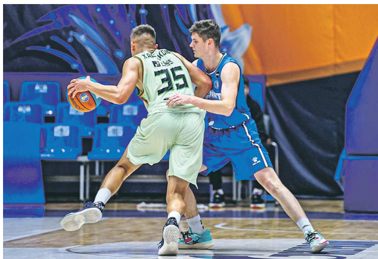
Баскетболисты «Уралмаша-2» стартовали в Единой молодежной лиге ВТБ матчами с «Зенитом-М»

Летом мы проводили просмотр и отобрали 16-17 человек.