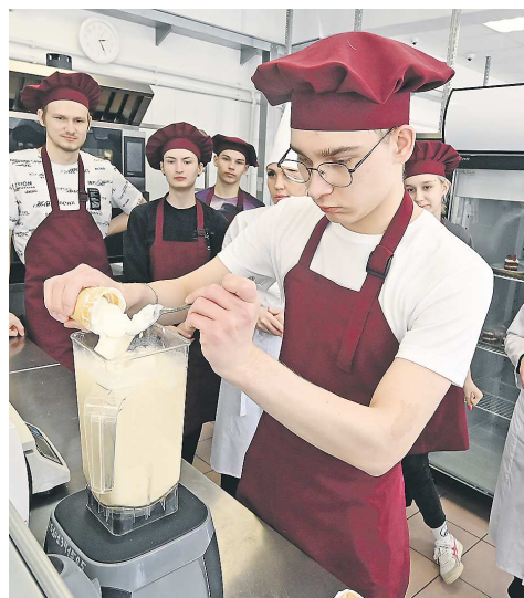
«Профессионалитет» позволяет не только получить актуальную профессию, но практически гарантирует трудоустройство

Колледжи Свердловской области, входящие в кластеры проекта, проведут экскурсии для абитуриентов