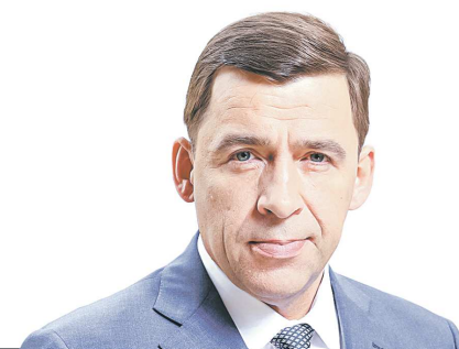
Евгений КУЙВАШЕВ, губернатор Свердловской области

« Несмотря на «легкий жанр», в театре не бывает легкомысленных спектаклей. Каждая постановка Музкома – это симфония смыслов, чувств и эмоций, это высочайшее мастерство и сложная драматургия, это важные вопросы, которые зритель задает самому себе после того, как закроется занавес. За это театр и любят не только жители Свердловской области, но и ценители искусства всей России.