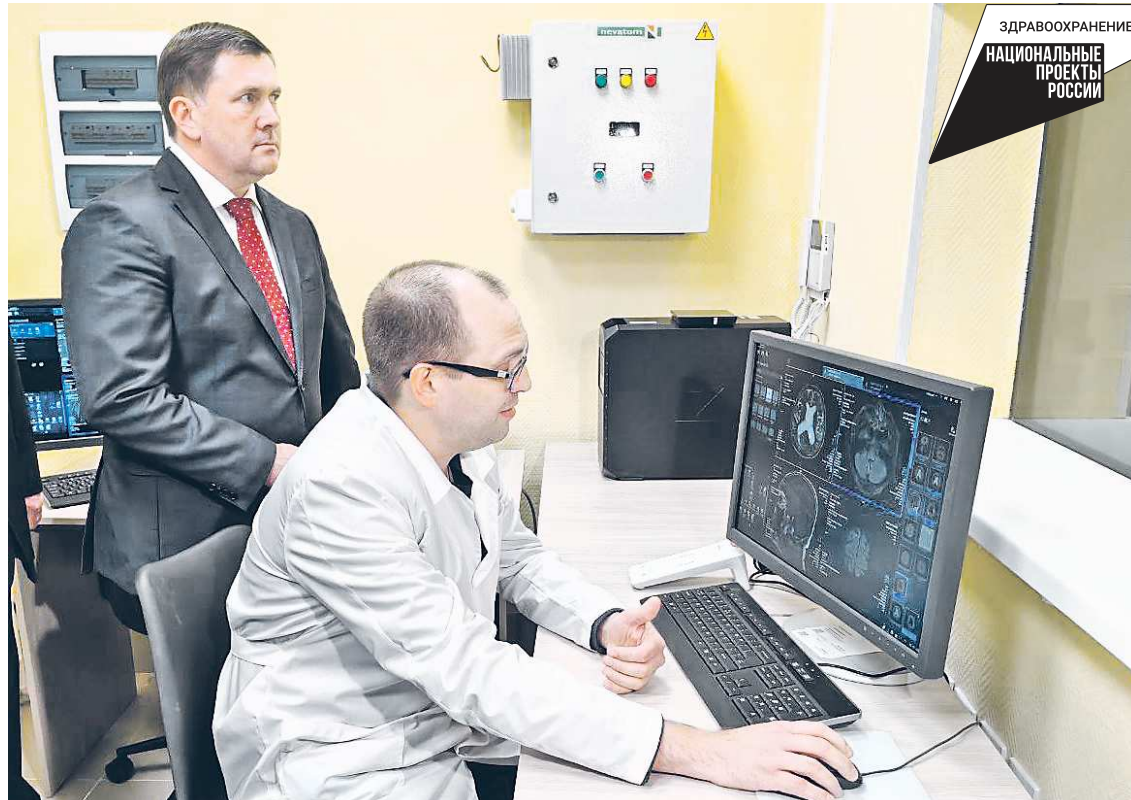
Первый заместитель губернатора Алексей Шмыков считает, что установка МРТ – важный этап комплексной работы по созданию качественной городской инфраструктуры свердловских муниципалитетов

– В этом году в регионе ведется серьезная работа по укреплению первичного звена здравоохранения. Общая сумма финансирования составила более 1,9 миллиарда рублей, из них более 1,7 миллиарда – средства федерального бюджета. На сегодняшний день поддержку получили 72 учреждения. Список мер поддержки широк: это ремонт фельдшер-