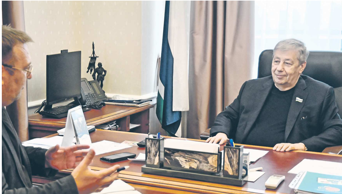
Первый всенародно избранный глава Екатеринбурга Аркадий Чернецкий, работая в законодательной власти, всегда отстаивал интересы муниципалитетов

Нельзя сказать, что все эксперименты были удачными, но то, что они, в принципе, имели возможность появиться, говорит о тех возможностях, которые были у региональных законодателей, и о том, что первые составы областного парламента работали с душой, искали оптимальные пути развития общества, развития экономики и социальной сферы, пытаясь в региональных законах закрепить новые нормы.