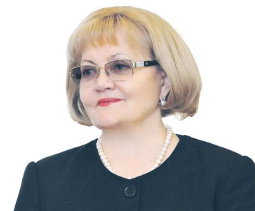
Людмила БАБУШКИНА, председатель Законодательного Собрания Свердловской области

“ Деятельность Законодательного Собрания Свердловской области всегда строилась на тесном сотрудничестве со всеми ветвями власти и общественными институтами. Парламентарии предыдущих созывов внесли значительный вклад в развитие регионального законодательства, став первопроходцами в правовом регулировании многих сфер деятельности.