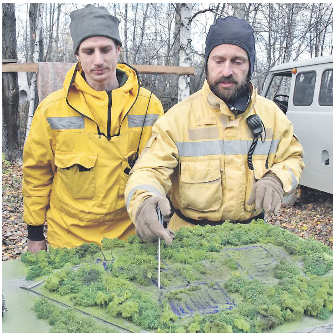
Для теоретической части учений был создан специальный макет

Репортаж о ходе учений читайте в ближайших номерах «ОГ»