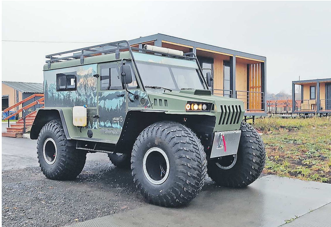
Новый снегоболотоход гаринцы в шутку называют «монстром» и «зверем». На такой машине – хоть куда, говорят они

К слову, в 2024 году гаринцы планируют организовать промысловую рыбалку на более