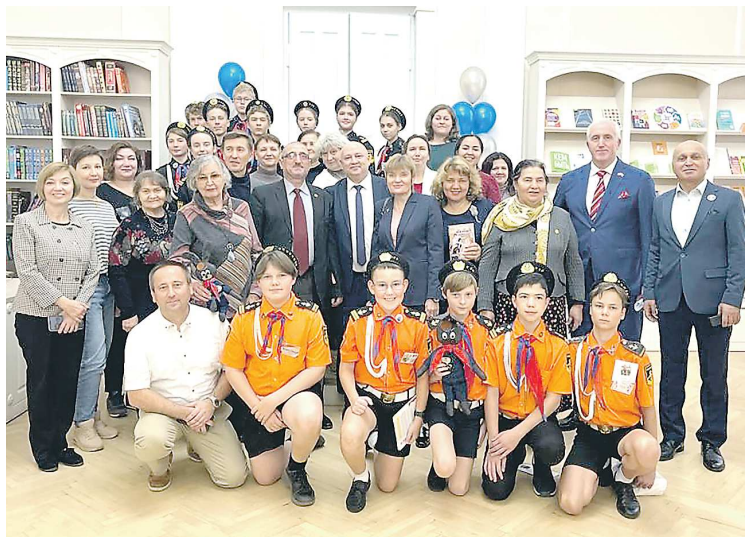
Лауреаты, организаторы и гости Литературной премии им. Владислава Крапивина на торжественной церемонии

– Премия задумывалась Владиславом Петровичем для оказания всемерной помощи и поддержки писателям, пишущим для детей и молодежи, которым весьма трудно пробиться в издательство. Обладая званием лауреата, сделать это, конечно же, проще. Очень важное дело затеял и