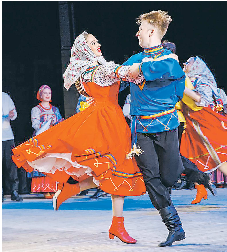
«Большой уральский перепляс», «Семёра», «Барыня-сударыня», «Горенка»... Многие танцы, ставшие легендой, продолжают жить на сцене