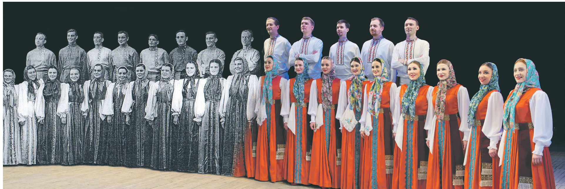
Фотоколлаж, созданный в Уральском хоре к юбилею, образно и символично соединил разные поколения коллектива: истоки, первых исполнителей – и день сегодняшний