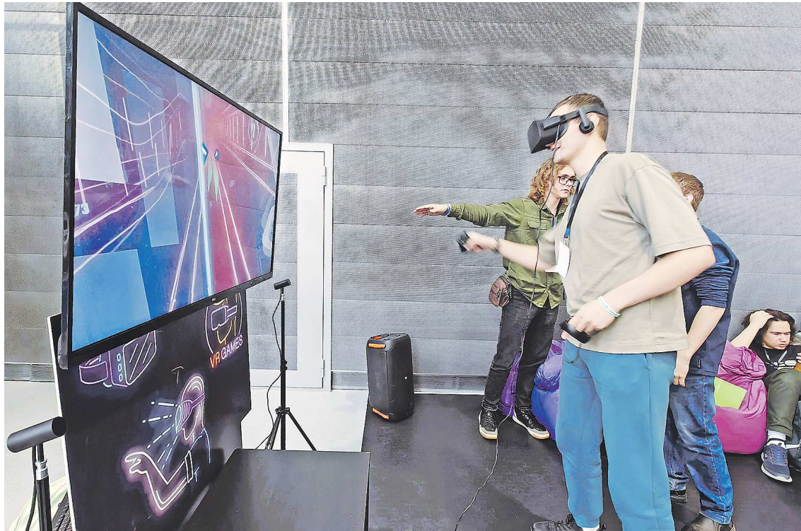
Между образовательными лекциями участники фестиваля Rucode решали интерактивные задачи и играли в VR-игры

Первый день фестиваля был посвящен искусственному интеллекту. Настоящий праздник