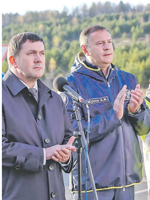
Первыми по обновленному участку трассы проехали 20 дорожных машин

Почти 20-километровый участок Пермского тракта (Р-242) – с 212 по 232 километр – введен с опережением графика. Строители расширили проезжую часть с двух до четырех полос движения, обустроили осевое парапетное ограждение, исключаящее вы-