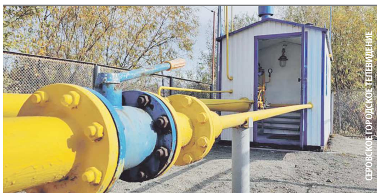
Серов – один из городов-лидеров Свердловской области по догазификации