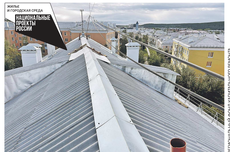
При капремонте самым частым объектом реконструкции в этом году были крыши

По информации регионального Фонда содействия капитальному ремонту, с начала года уже отремонтировано 358 крыш, 139 подвальных помещений, 107 фасадов, 136 систем холодного и 110 систем горячего водоснабжения. Кроме то-