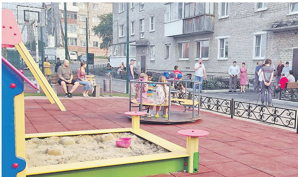
Так теперь выглядит благоустроенный двор в Ирбите на улице Подгорной, 1в

– По факту это целый квартал в центре города, комфортный для жизни, – рассказал «ОГ» глава Волчанска Александр Вервейн . – Есть и лавочки, и дорожки, и детские игровые комплексы, и тренажеры. Вложили в проект муниципальные средства – более 30 млн рублей.