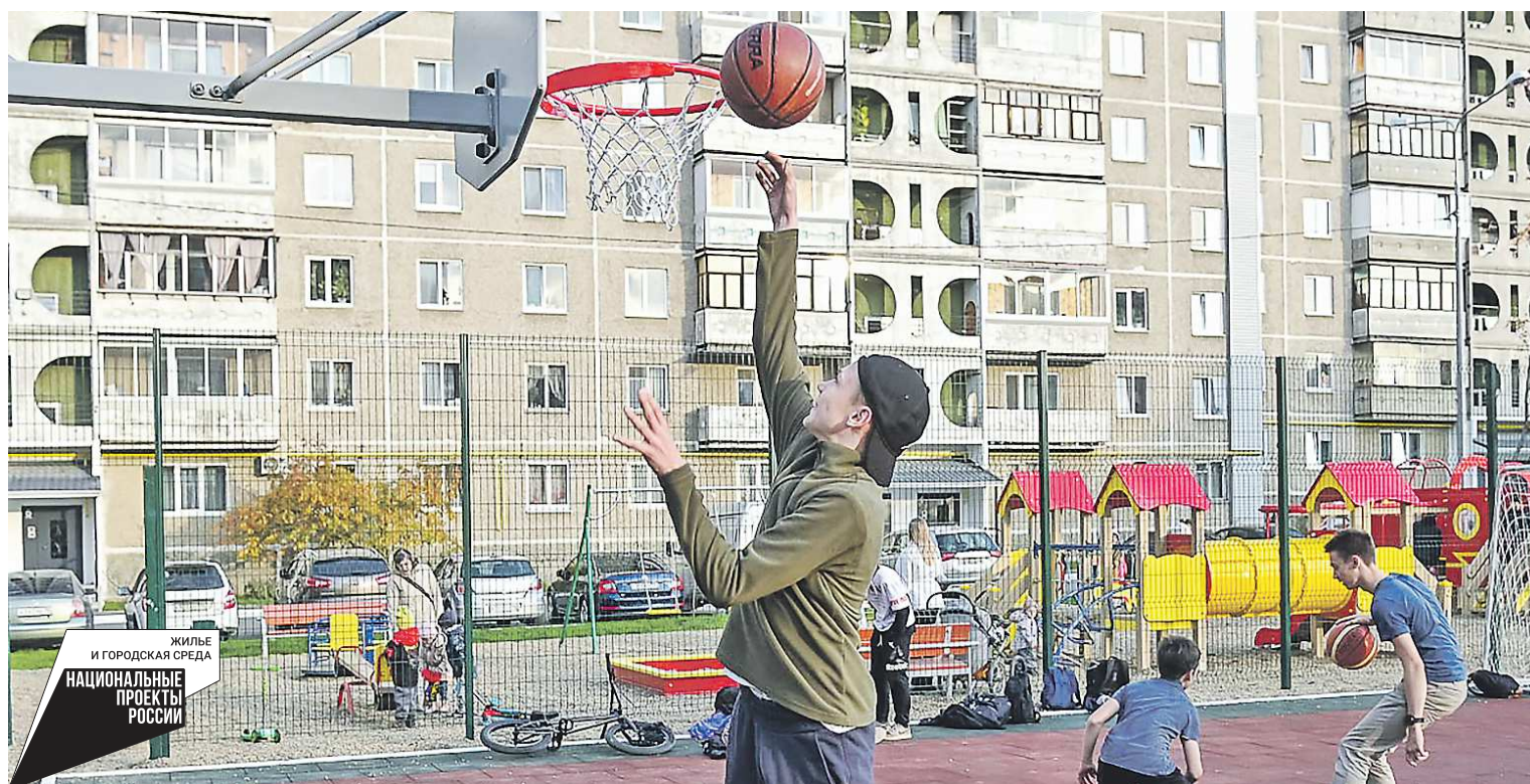
Благоустроенный двор на улице Дружинина, 39 в Нижнем Тагиле – есть все для активного отдыха молодежи

В свердловских муниципалитетах преобразуются придомовые пространства