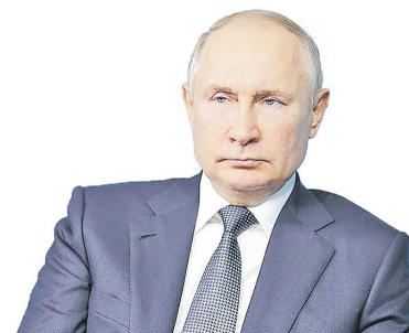
Владимир ПУТИН, Президент России

“ Учитель – мы часто об этом говорим, и это действительно именно так, – не просто профессия. Это призвание, благородная, важнейшая по сути своей миссия. Ваш труд, терпение, забота и поддержка помогают каждому раскрыть свои способности, лучшие человеческие качества, обрести знания и духовные ценности, которые навсегда станут надежной опорой в жизни. Своих школьных наставников, их советы, душевное участие мы неизменно, даже спустя долгие годы, вспоминаем с любовью и признательностью.