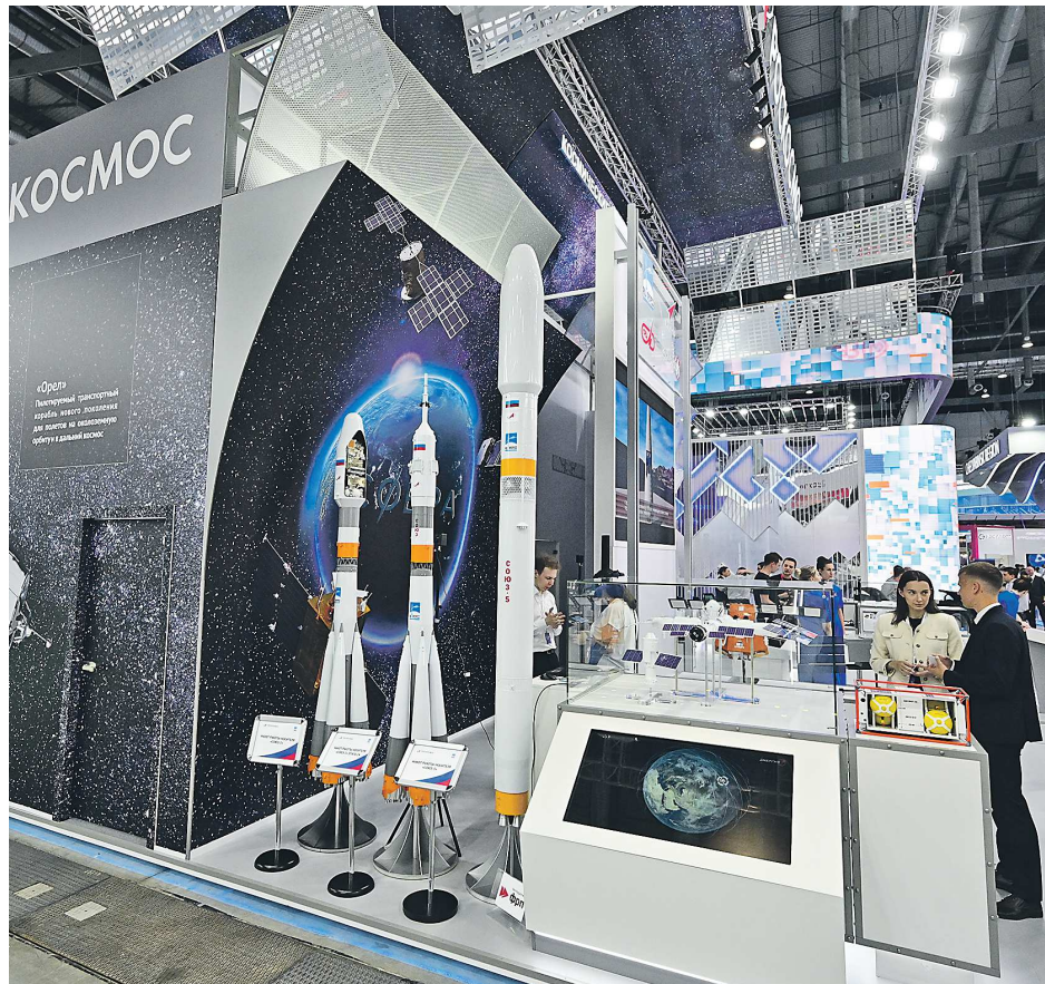
Соглашение о создании экосистемы «Космос» было подписано на международной выставке ИННОПРОМ

– Мы создаем инновационную среду, где выстраиваются связи. За счет это-