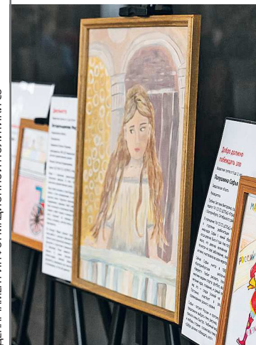
Все рисунки размещены на сайте ямогуярисую.рф