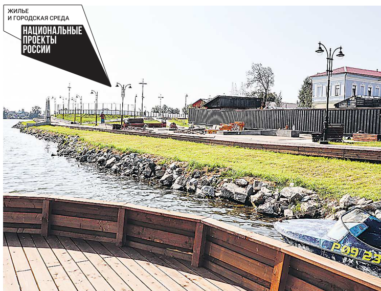
Набережная будет открыта для свободного посещения и подходит для любого вида досуга

С набережной открывается красивый вид на недавно восстановленный Спасо-Преображенский собор, плотину пруда и, конечно, на саму Невьянскую башню. То есть мы благоустроили центральную часть города, которая всегда была местом