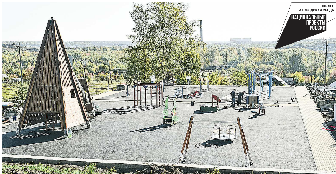
Новые площадки микрорайона скоро примут детей и подростков

В Верхней Туре благоустраивают микрорайон «Рига»