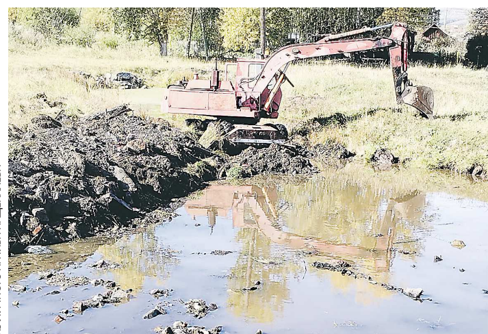
Работы ведутся еще с сентября

В поселке идут работы по углублению дна реки Нейвы в районе улиц Ленина и Нейвинской. Береговую линию также планируется укрепить.