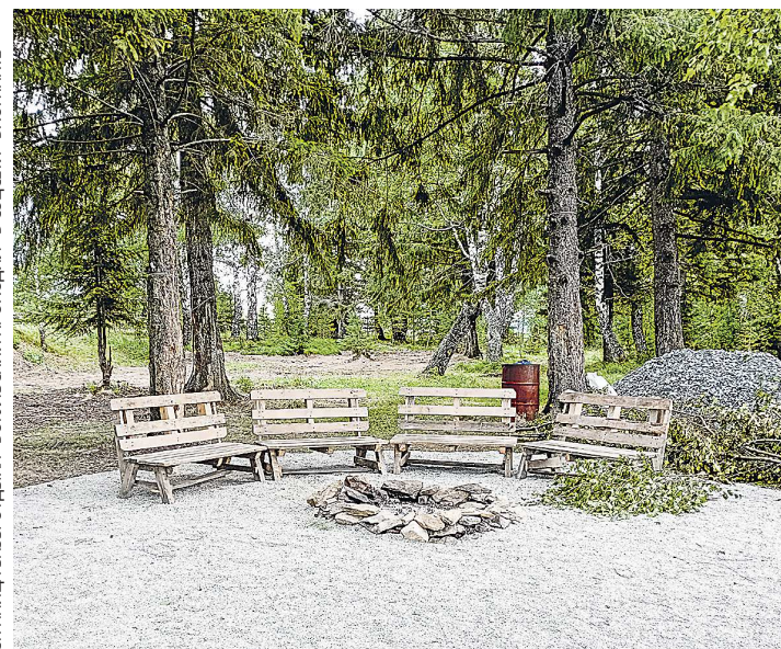
На турбазе уже появилась зона у костра, где будет приятно сидеть по вечерам

На берегу городского пруда началось строительство туристической базы под названием «Вогульский крокодил». Полностью реализовать проект планируется в 2024 году – к началу летнего сезона.