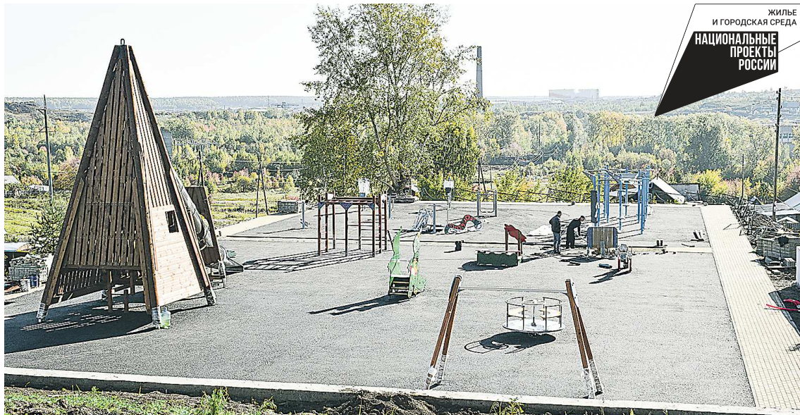
Новые площадки микрорайона скоро примут детей и подростков

В Верхней Туре благоустраивают микрорайон «Рига»