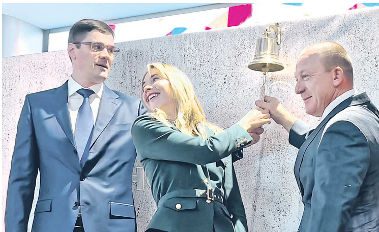
Александр Попов, Анжелика Тиманина и Дмитрий Саутин дают старт Кубку чемпионов

На торжественную церемонию открытия турнира приехали Александр Попов, олимпийская чемпионка по синхронному плаванию, одиннадцатикратная чемпионка мира Анжелика