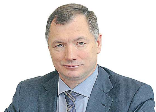
Марат ХУЗНУЛИН, вице-премьер РФ