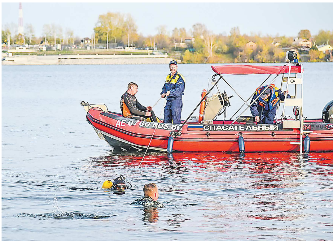
Нижнетагильские спасатели тестируют новый катер на городском пруду

Помимо катера в этом году для спасателей муниципалитет приобрел 24 ранцевых огнетушителя, два прицепа, два пожарных модуля для квадроцикла ППМК-0.2, гидрокостюм спасателя, полукомбинезоны, лопаты, грабли и сорбенты для удаления пятен нефти и стоков нефтепродуктов с поверхности воды и с почв. На эти цели из муниципального бюджета было выделено 3,8 млн рублей.