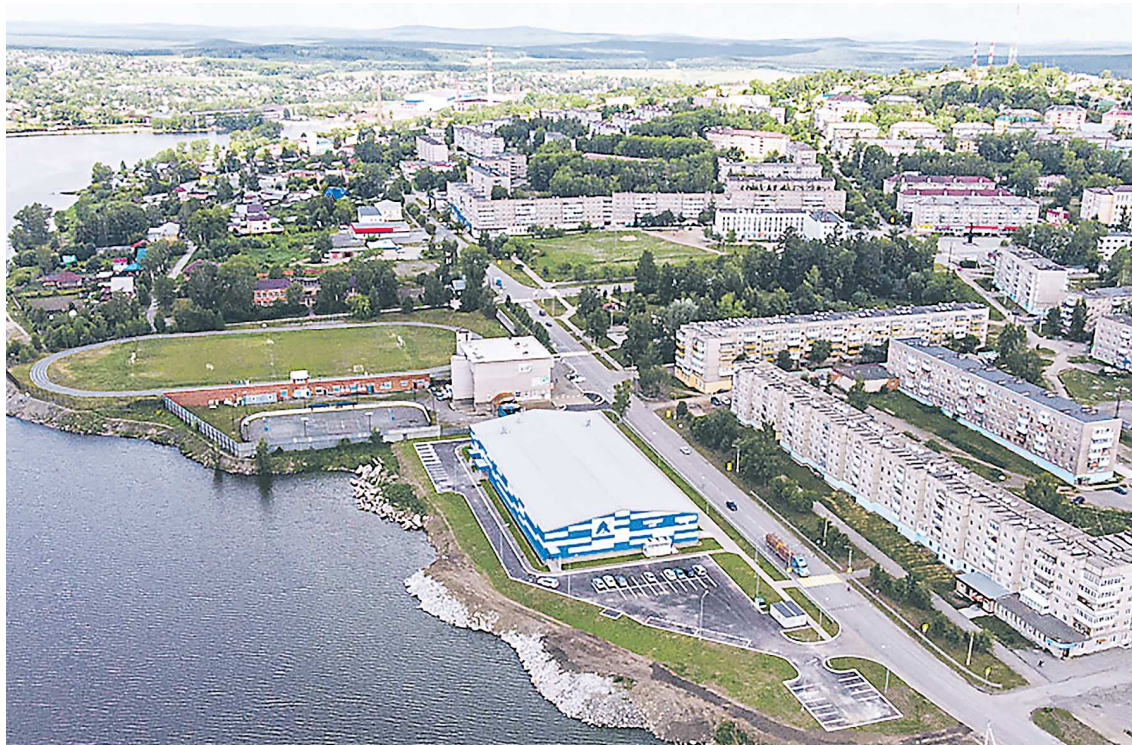
Так живописно выглядит Кушва с высоты птичьего полета

Один из крупнейших проектов – строительство детского оздоровительного лагеря в верховьях Кушвинского пруда. Главным инвестором здесь выступит медеплавильный комбинат «Святогор».