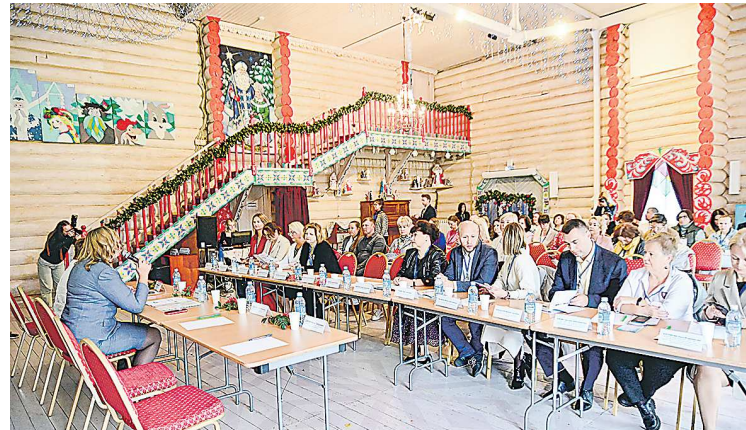
Научно-практическая конференция прошла во дворце Урал Мороза

Участники конференции обсудили новые вызовы, стоящие перед образовательными учреждениями в обеспечении кадровыми ресурсами индустрии туризма и гостеприимства, развитие волонтерства в отрасли, ор-