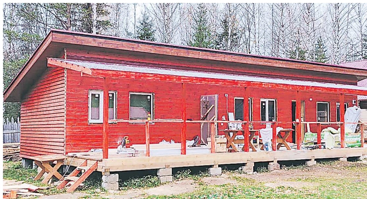
Гостевой таунхаус на базе отдыха «Серебрянский Камень» под Карпинском. Завершаются строительные работы

Основная цель этого проекта – развитие туристической инфраструктуры Верхотурского городского округа именно путем расширения доступности кру-