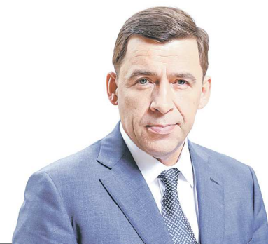
Евгений КУЙВАШЕВ, губернатор Свердловской области

«Конкурс «Достояние Среднего Урала» – это отличный способ сохранить традиции, историческое и культурное наследие нашего региона. Прекрасная возможность привлечь внимание к местам, событиям и явлениям, которые определяют облик Свердловской области, подчеркивают ее самобытность.