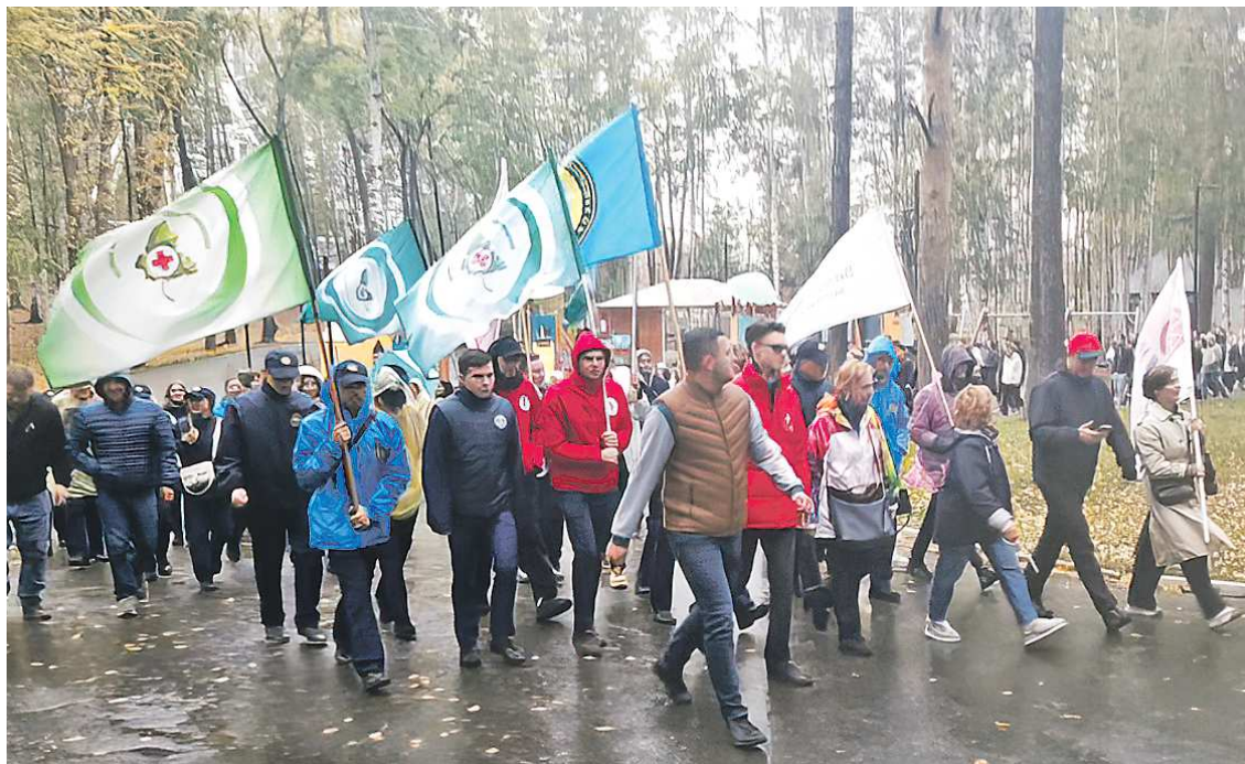
На совместную прогулку 30 сентября пришло большое количество представителей молодого поколения

«Обратите внимание, что это не единственное мероприятие в поддержку двигательной активности, которое стало хорошей традицией среди уральцев. Все больше свердловчан выбирают