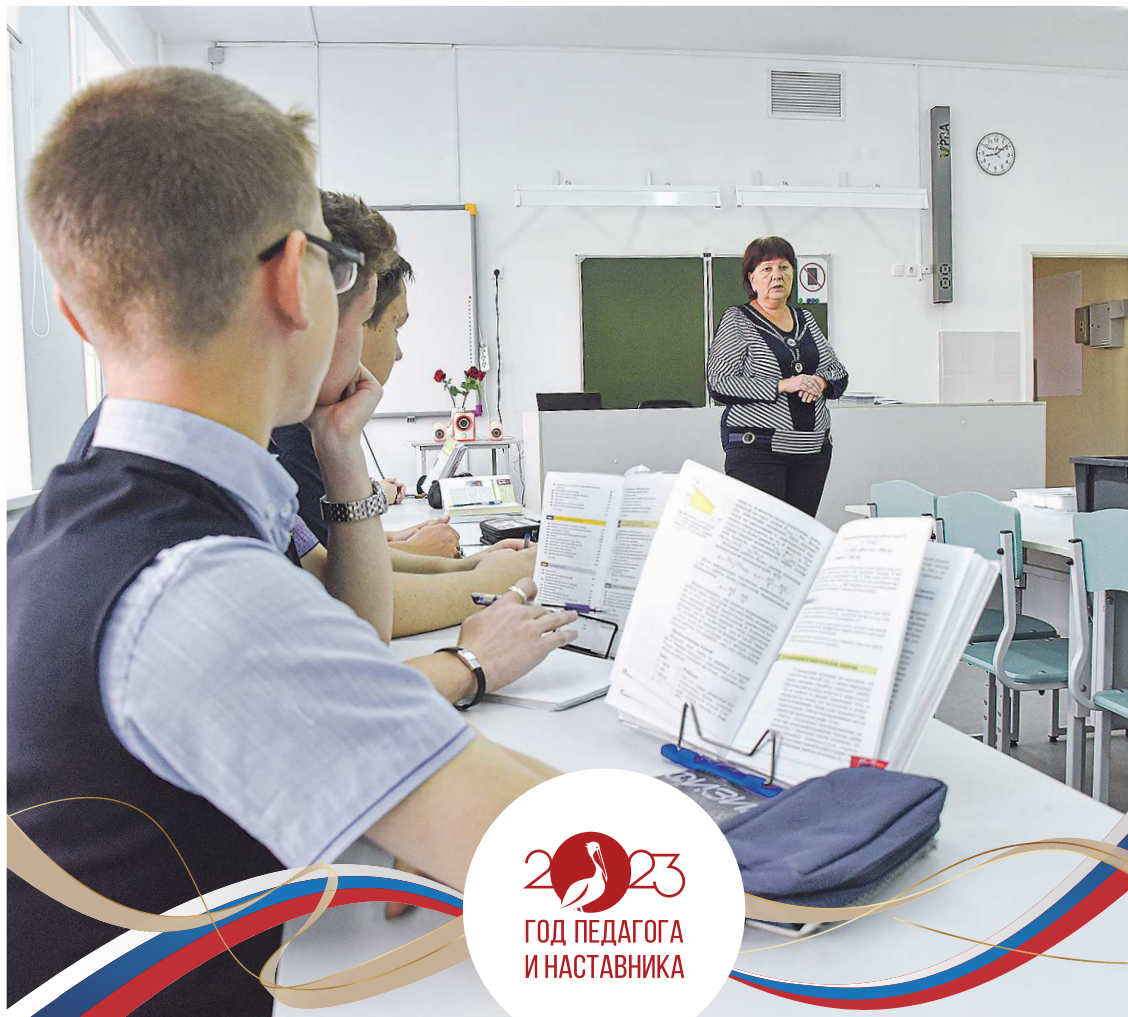
В Свердловской области вопросам поддержки педагогов уделяют повышенное внимание