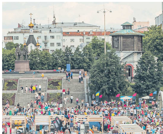
Плотинка – любимое место екатеринбуржцев