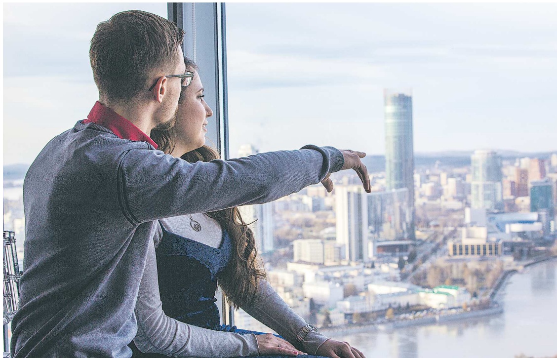
Все объекты Екатеринбурга, номинированные на участие в конкурсе, расположены в историческом центре города