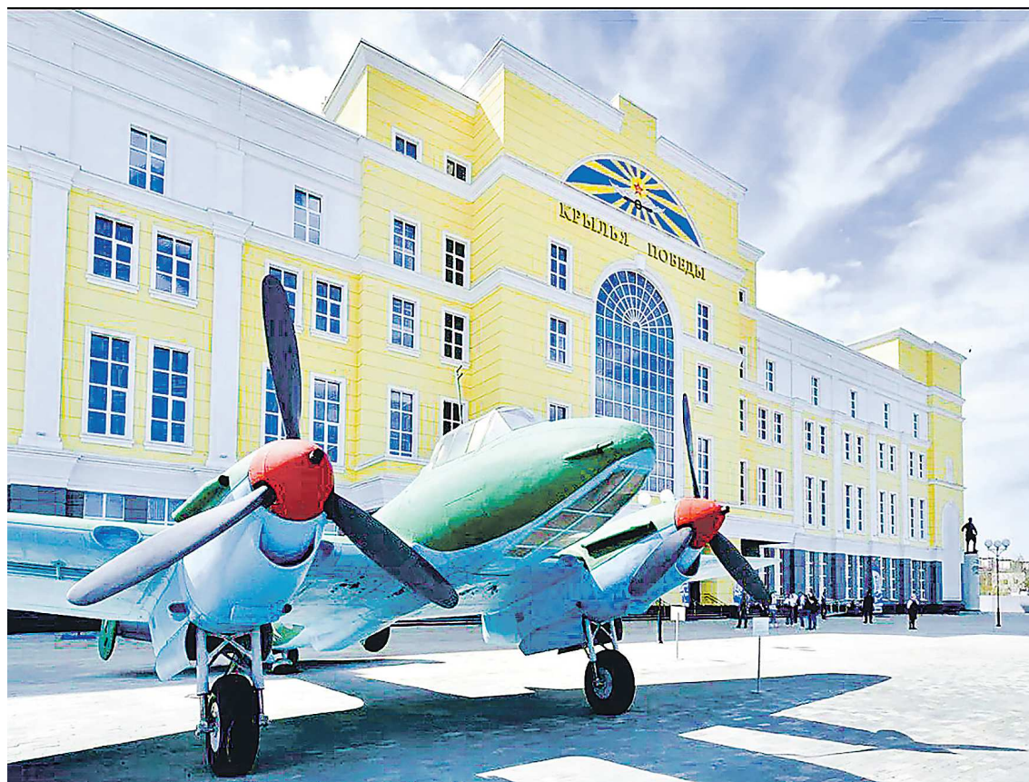
Музейный комплекс УГМК – крупнейшая техническая музейная площадка в Европе

Основу музейного комплекса «Северская домна» составляет домна – единственный в Европе шедевр уральской промышлен-