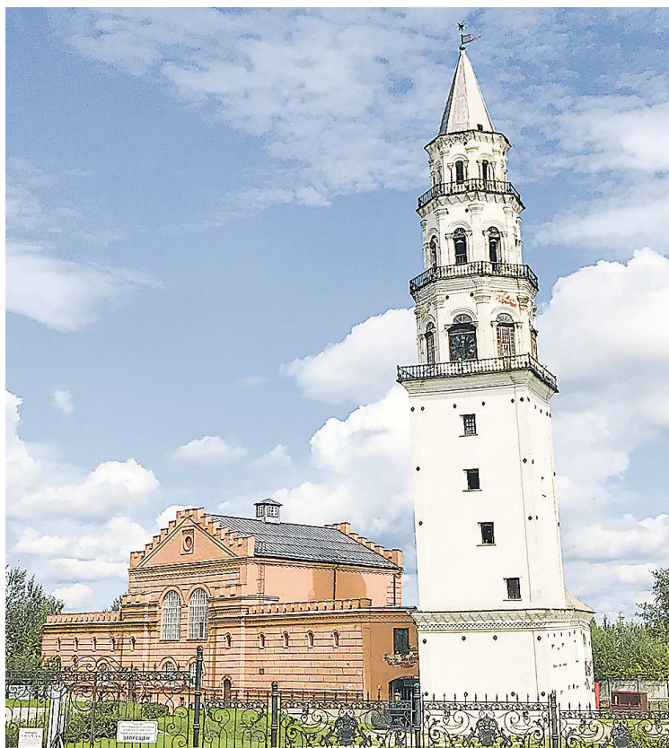
Толстые стены Невьянской наклонной башни надежно хранят ее тайны

«Невьянская башня – архитектурный символ Свердловской области. Это удивительное сооружение, на разных этажах которого размещались когда-то и арестантская палатка, и