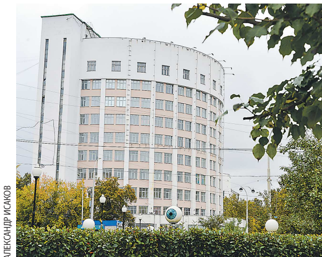
Ранее на гостинице «Исеть» был размещен лозунг «Вперёд к коммунизму!»