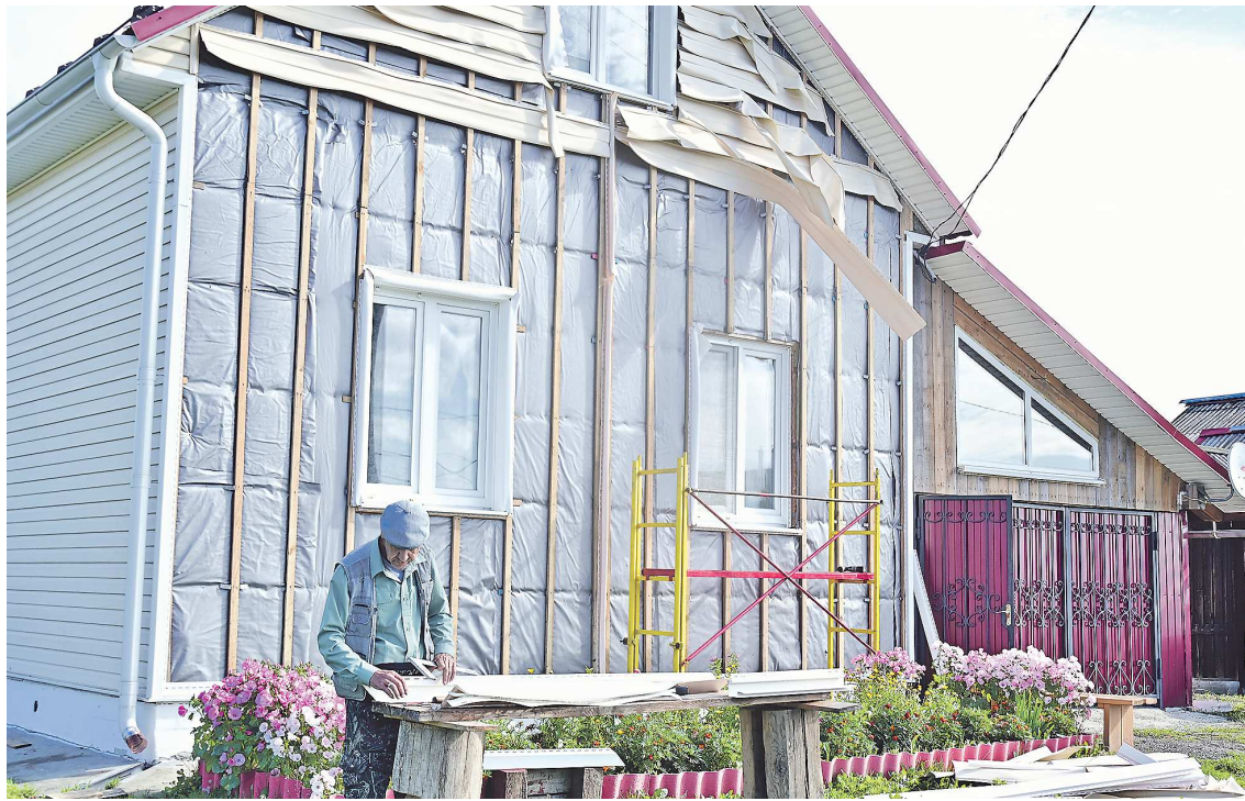
Этот дом по улице Ленина в Шайдурихе пострадал частично – оплавился сайдинг, владельцу положена выплата 10 тысяч рублей за частичную потерю имущества

– Оказываем помощь по восстановлению документов, утраченных во время пожара. Консультируем по земельным вопросам. Десять заявлений направили в суд по установлению