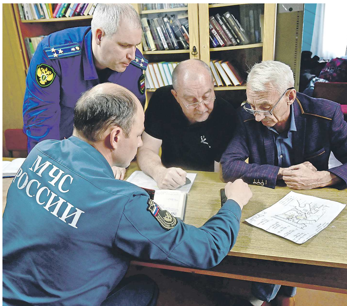
Оперативный штаб в ДК Шайдурихи работает ежедневно с 9.00 до 18.00: на контроле все актуальные задачи

– Снабдили газовыми плитками. Фонд Святой Екатерины привез продуктовые наборы –