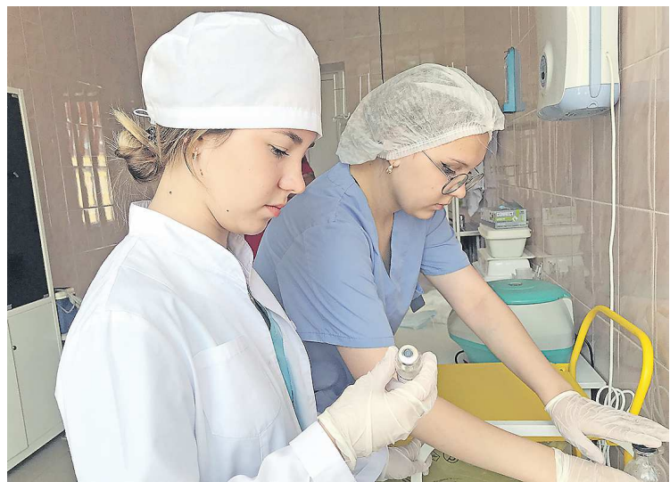
Студенты относятся к своим обязанностям максимально ответственно