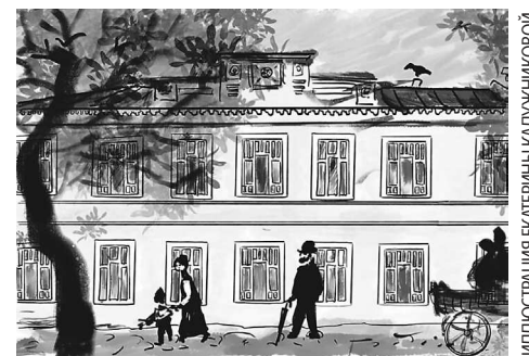
Исследовательская группа несколько лет собирала материалы в архивах, а волонтеры фонда записывали воспоминания жителей города