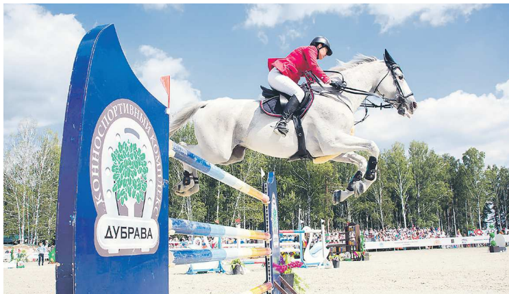
Один из главных фестивалей лета начинается уже в эти выходные – это «ЛЕТОФЕСТ»

Адрес: Тюменский тракт, п. Верхнее Дуброво, ул. Манежная, 1.