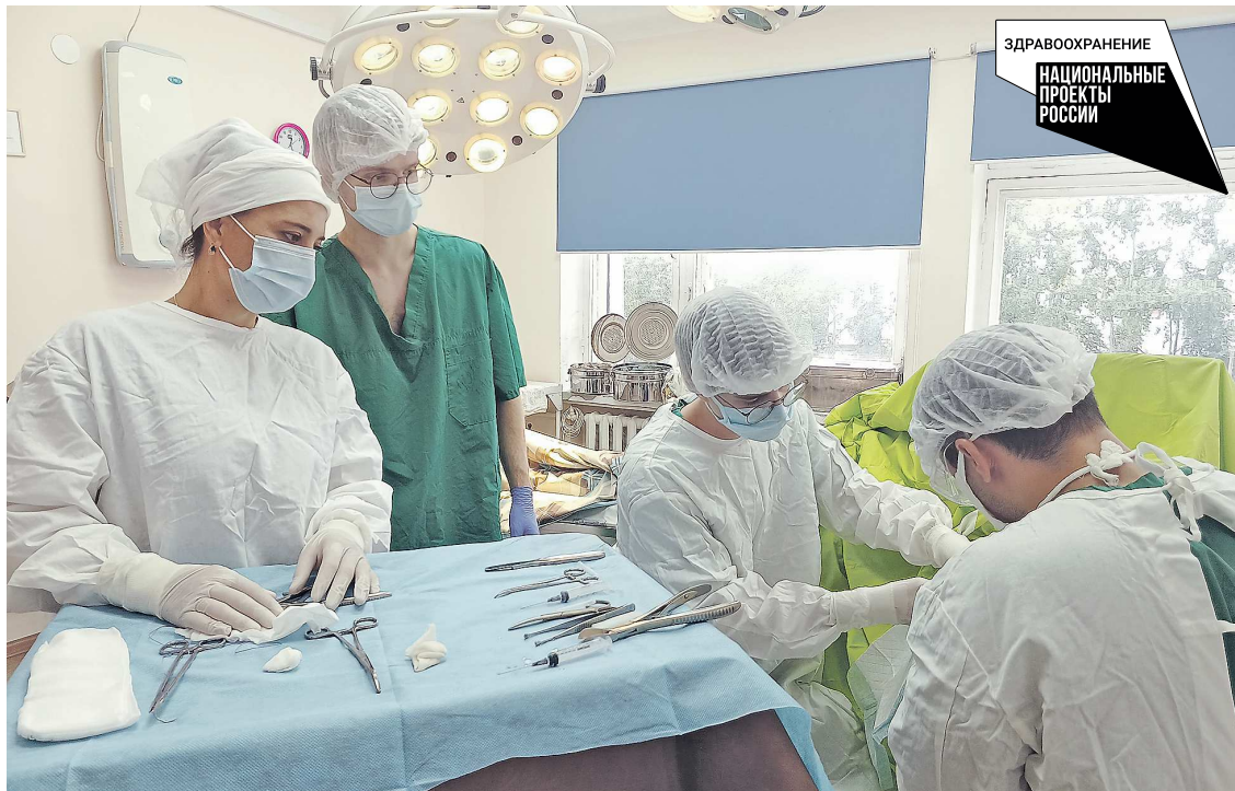
В горбольнице Асбеста созданы все условия, чтобы студенты медотряда «Пульс» могли в полном объеме проявить свой потенциал

Обеспечение региональной медицины квалифицированными кадрами – важная задача нацпроекта «Здравоохранение». В Свердловской области по поручению Евгения Куйвашева с 2018 года реализуется программа целевого обучения будущих врачей за счет средств бюджета региона. Она призвана решить проблему нехватки специалистов в малых городах и селах. В настоящее время по губернаторскому набору в УГМУ обучаются 932 человека. Многие из них сейчас работают в медучреждениях Красноту-