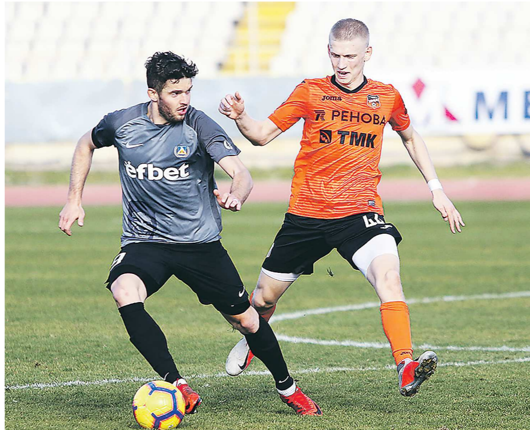
В 2019-м году «Урал» играл с «Левски» на кипрских сборах и победил тогда со счетом 2:1

– Уже 25 января (то есть сегодня, – Прим. «ОГ»)) мы должны провести первый контрольный матч против команды «Ботев». Никаких сообщений об угрозе отмены этой встречи нет, наша команда готовится сыграть с болгарскими футболистами, – рассказали «Областной газете» в пресс-службе команды.