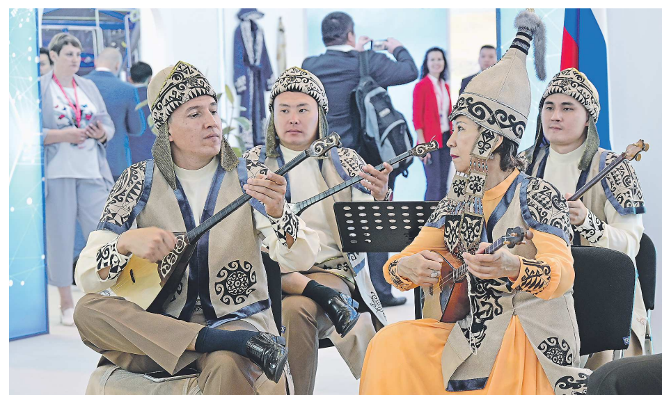
Не только белорусы, но и казахи радовали участников ИННОПРОМ-2023 выступлениями своих творческих коллективов

Выставка ИННОПРОМ-2023 окончена. На выходе из международного выставочного центра «Екатеринбург-ЭКСПО», делегатов провожает надпись: «До встречи на ИННОПРОМ-2024 – 8-11 июля».