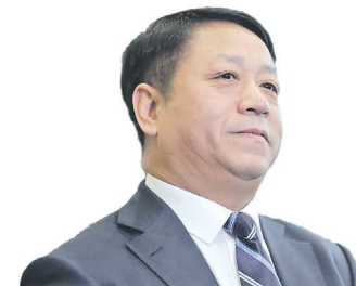
Чжан ХАНЬХУЭЙ, Чрезвычайный и Полномочный Посол КНР в России

“ На прошлогодней выставке Казахстан выступил страной-партнером. На сегодня пул совместных проектов расширен до 125 с общим объемом инвестиций свыше 33 миллиардов долларов. Из них мы уже реализовали 30 проектов на сумму 3,2 миллиарда долларов. В реализации – еще 40 совместных проектов на сумму почти 17 миллиардов долларов. На стадии проработки 55 проектов на общую сумму почти 14 миллиардов долларов.