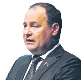
Роман ГОЛОВЧЕНКО, премьер-министр Республики Беларусь

“ Самое главное – мы переходим от дискуссий, обсуждений и пленумов к принятию конкретных решений. Считаю не лишним повторить, что Беларусь и Россия в сжатые сроки наработали уже 17 импортозамещающих инвестиционных проектов машиностроения, микроэлектроники на общую сумму свыше 80 миллиардов российских рублей, и этот список остается открытым, работа продолжается.