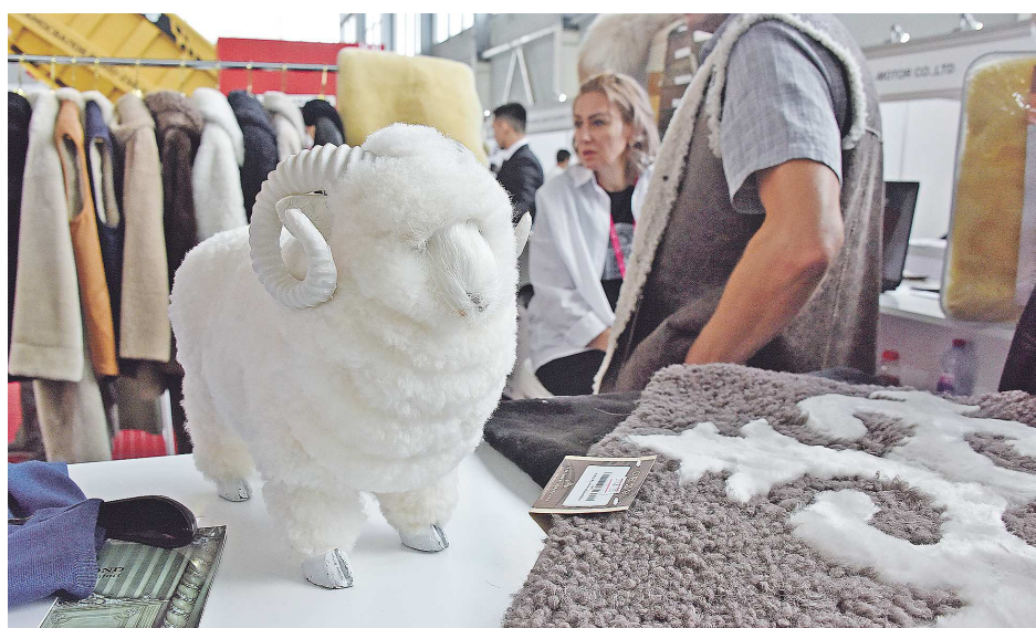
Кыргызстан славится своей текстильной продукцией. На стенде её образцы пользовались особым интересом