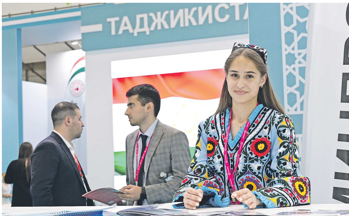
Мимо национальных стендов республик Средней Азии пройти было невозможно: они привлекали своей яркой красотой

По словам представителя министерства туризма и куль-