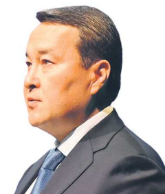
Алихан СМАИЛОВ, премьер-министр Республики Казахстан

“ Самое главное – мы переходим от дискуссий, обсуждений и пленумов к принятию конкретных решений. Считаю не лишним повторить, что Беларусь и Россия в сжатые сроки наработали уже 17 импортозамещающих инвестиционных проектов машиностроения, микроэлектроники на общую сумму свыше 80 миллиардов российских рублей, и этот список остается открытым, работа продолжается.