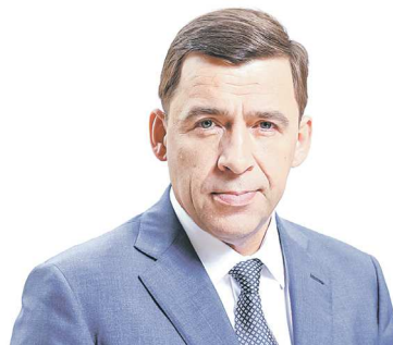
Евгений КУЙВАШЕВ, губернатор Свердловской области

На церемонии вручения второй премии «Молодой промышленник года» на ИННОПРОМе-2023