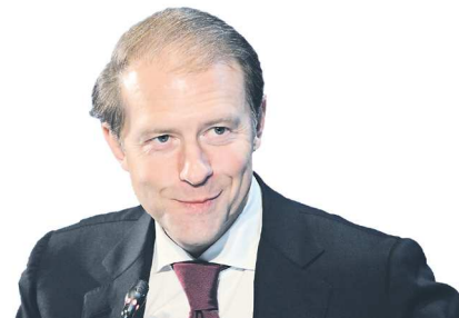
Денис МАНТУРОВ, заместитель председателя Правительства России – министр промышленности и торговли РФ

“ Я хочу поблагодарить каждого из вас, кто заинтересованно развивает российскую промышленность в разных сегментах. Уверен, что вы воспользуетесь сегодняшними вызовами – хотя мы говорим о них как о возможностях – чтобы реализовать себя. Сегодня есть достаточно широкий инструментарий, который позволяет реализовывать и масштабные, и среднего размера проекты, и стартапы. Поэтому на всех этапах ваших задумок можно получить нашу поддержку.