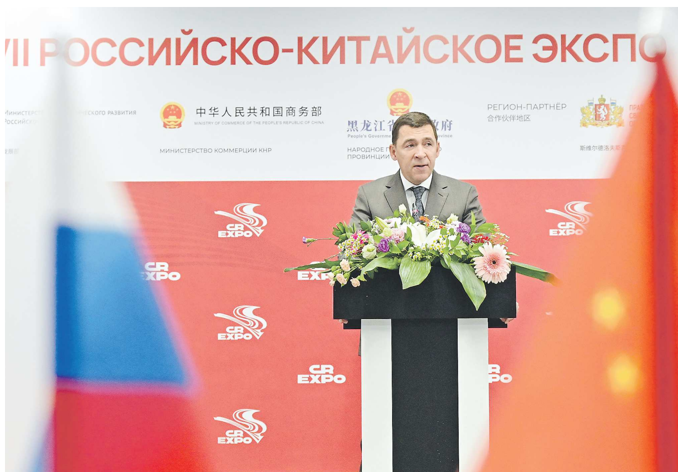
Сотрудничество с Китаем имеет особое значение для Свердловской области. Республика является ключевым внешнеторговым партнером региона

Партнерство Свердловской области и Поднебесной крепнет и расширяется