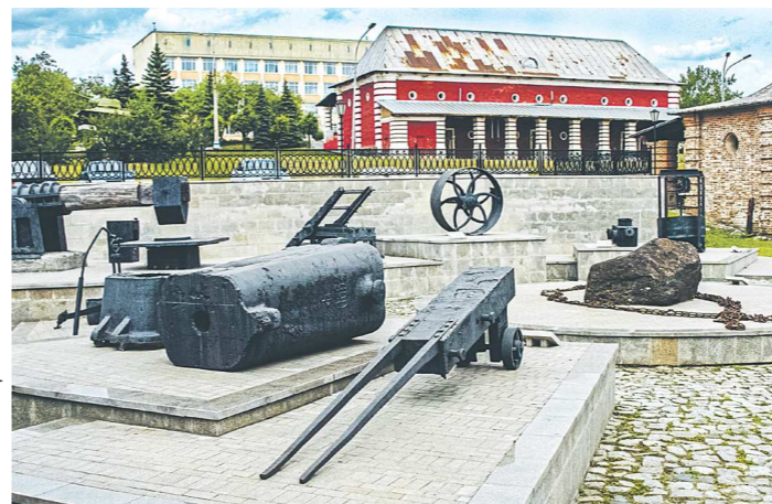
К заводу примыкает экспозиция горнозаводской техники под открытым небом — различное промышленное оборудование XVIII-XIX веков

Внести свои предложения, поделиться интересными фактами об истории завода и узнать статус разработки проекта жители Свердловской области могут на сайте demidov-park.ru