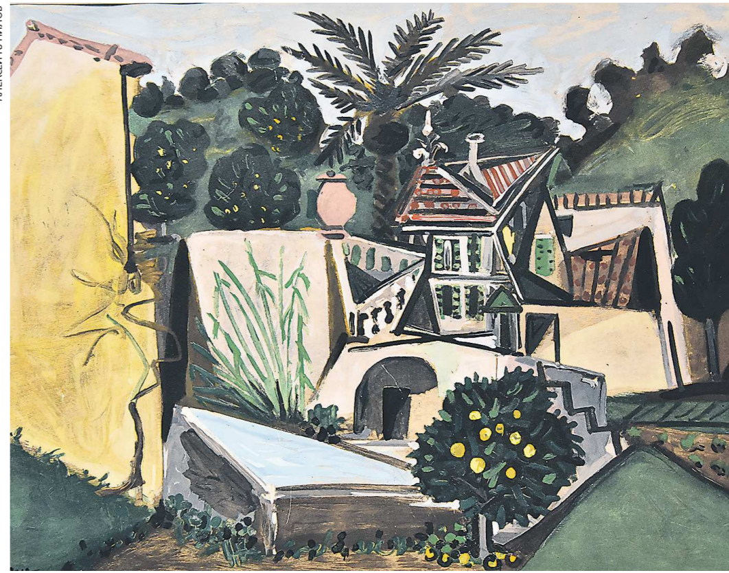
На этой же выставке – великий мастер Пабло Пикассо. Картина «Вилла Пальмир» 1965 год