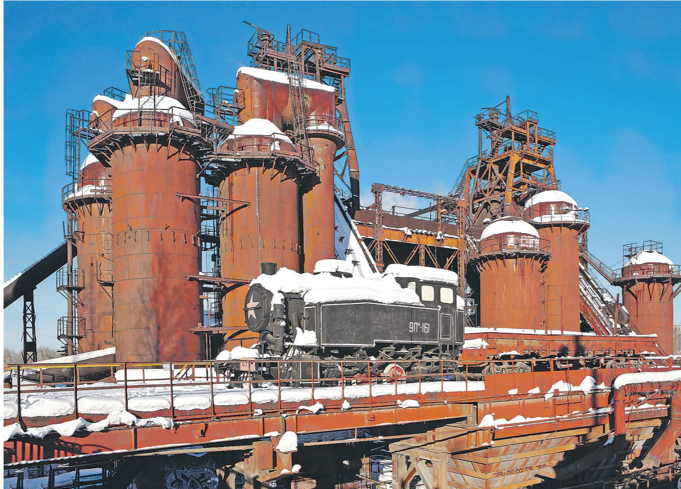
Сооружения старого Демидовского завода возрастом более 150 лет занесены в список памятников промышленной архитектуры России

Важной составной частью большого проекта станет капремонт моста-плотины по улице Челюскинцев, примыкающей к старому Демидовскому заводу. Путь пролегал в 1928 году,