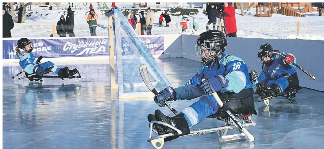
Перед началом матча состоялось показательное выступление игроков екатеринбургского «Торнадо» – детской команды по следж-хоккею. Следж-хоккей (хоккей на санях) – это аналог хоккея с шайбой для людей с ограниченными возможностями. Игроки сидят в санях и пользуются двумя клюшками с деревянным крючком на одном конце (для работы с шайбой) и с зубьями – на другом (для передвижения по льду)