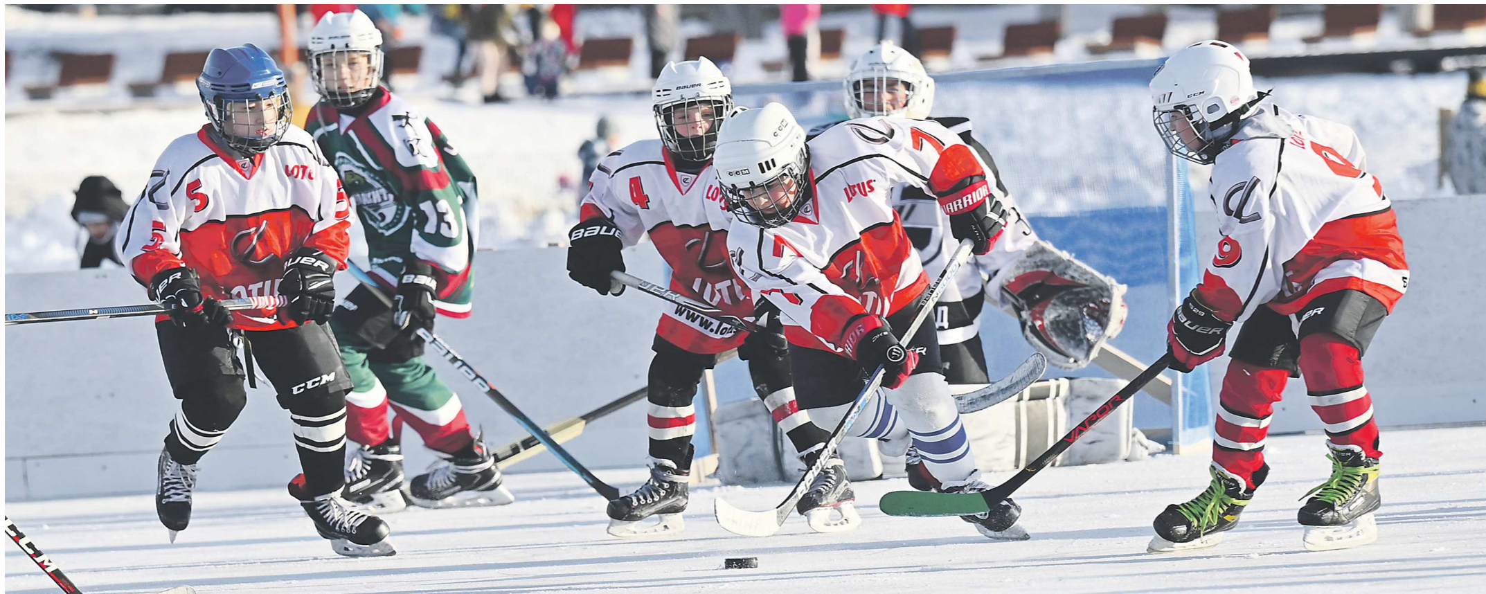
Детские пятёрки играли друг с другом, но в воротах стояли вратари взрослых команд. Тем не менее юные хоккеисты смогли забросить две шайбы

Необычный матч в Сысерти: деревянные ворота, площадка с прямыми углами и никакой разметки