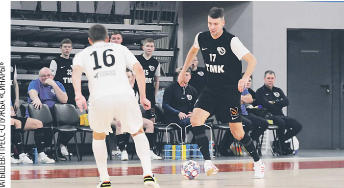
«Синара» проиграла «Норильскому никелю» шесть раз в семи последних встречах

В стартовой встрече команды устроили настоящую перестрелку. «Синара» трижды выходила вперед в первом тай-