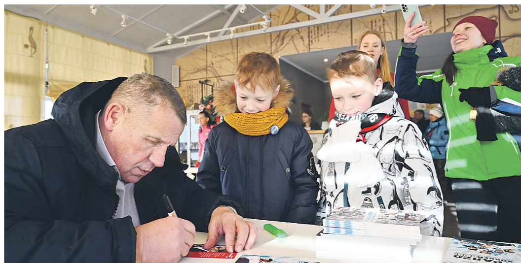
Автограф-сессия Николая Макарова