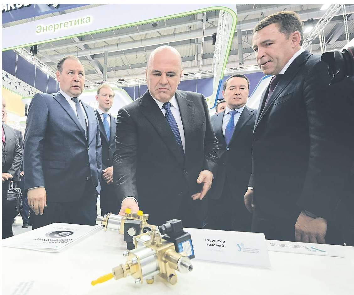
Михаил Мишустин заинтересовался разработками инжинирингового центра цифровых технологий машиностроения Уральского федерального университета

В числе продукции, презентованной главам правительств трех государств – изделия Инжинирингового центра цифровых технологий машиностроения Уральского федерального университета. Это, в частности, вентиляторное колесо высокого давления, выполненное методом реверсивного инжиниринга в рамках программы Минпромторга России по замещению критически важных компонентов. Оно используется в агротехнике для рассеивания семян. Производство этой детали, чьи характеристики в процессе разработки были улучшены, уже переведено в серию. Также инжиниринговый центр презентует на выставке опытный образец газового редуктора. Это оборудование востребовано в автомобилестроении и применяется в системе топливopодачи газовых автомобилей и автобусов.