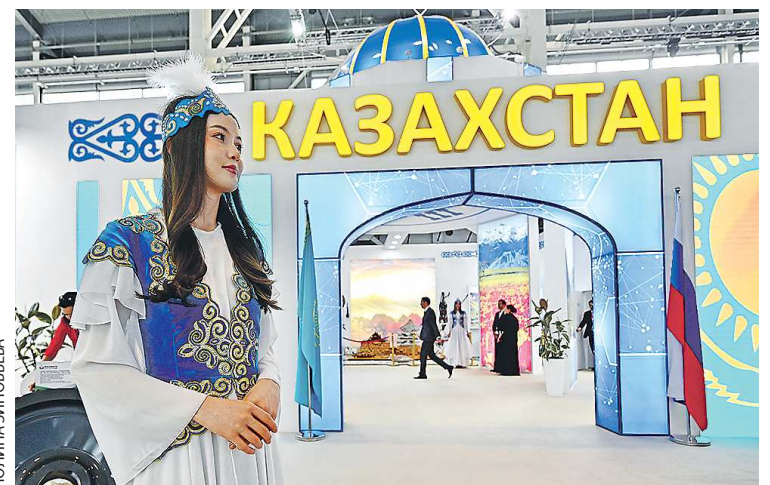
Стенд Казахстана на выставке ИННОПРОМ-2023

Напомним, генеральный консул Казахстана Жарас Мамутбеков приступил к исполнению обязанностей в июне. В консульский округ входят Свердловская, Тюменская, Челябинская, Курганская области и Пермский край.