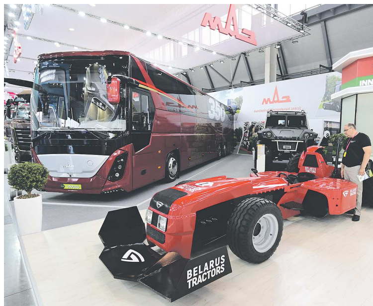
Спортивный болид от «Беларусь-трактор» привлекает внимание всех посетителей. На то и расчет. Но на самом деле он вообще не ездит, просто рекламный ход