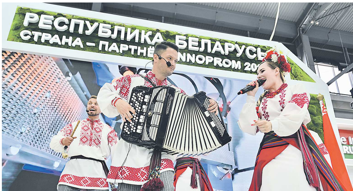
Зажигательные песни и танцы от творческих коллективов республики Беларусь никого не оставляют равнодушным: посетители подходят к сцене со всех сторон