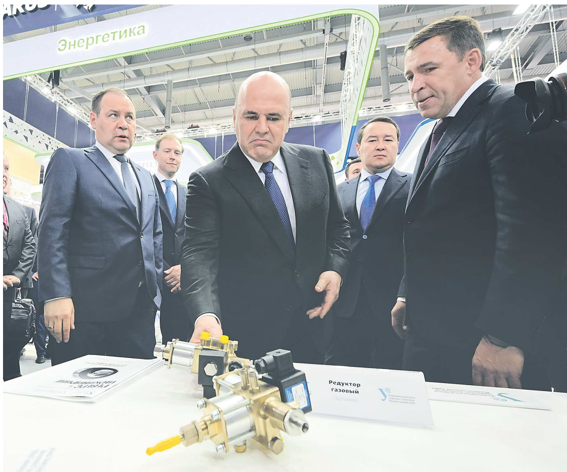
Михаил Мишустин заинтересовался разработками инжинирингового центра цифровых технологий машиностроения Уральского федерального университета

В числе продукции, презентованной главам правительств трех государств – изделия Инжинирингового центра цифровых технологий машиностроения Уральского федерального университета. Это, в частности, вентиляторное колесо высокого давления, выполненное методом реверсивного инжиниринга в рамках программы Минпромторга России по замещению критически важных компонентов. Оно используется в агротехнике для рассеивания семян. Производство этой детали, чьи характеристики в процессе разработки были улучшены, уже переведено в серию. Также инжиниринговый центр презентует на выставке опытный образец газового редуктора. Это оборудование востребовано в автомобилестроении и применяется в системе топливоподачи газовых автомобилей и автобусов.