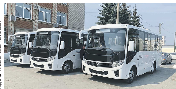
РЕДАКЦИЯ ГАЗЕТЫ «СЫСЕРТСКИЕ ВЕСТИ»

Три автобуса общей стоимостью 15 млн рублей вышли на маршруты в Сысерти на этой неделе. Два курсируют по городу, третий – до села Новоипатово. Средства на приобретение транспорта были выделены из областного бюджета.