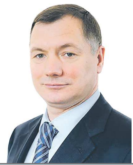
Марат ХУШНУЛЛИН, вице-премьер правительства Российской Федерации

“ В российских муниципалитетах создаются новые парки и скверы, строятся детские и спортивные площадки, благоустраиваются набережные. Индекс качества городской среды ежегодно растет. Наибольшую динамику за 2022 год показали Данков Липецкой области, Домодедово Московской области и Каменск-Уральский Свердловской области