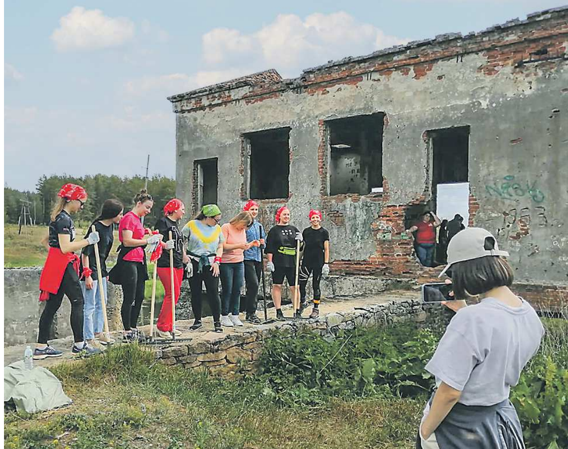
В проекте по благоустройству территорий вокруг руин активно принимают участие сельские женщины

Жители села Маминского в Каменском районе облагораживают территории вокруг полуразрушенных исторических зданий