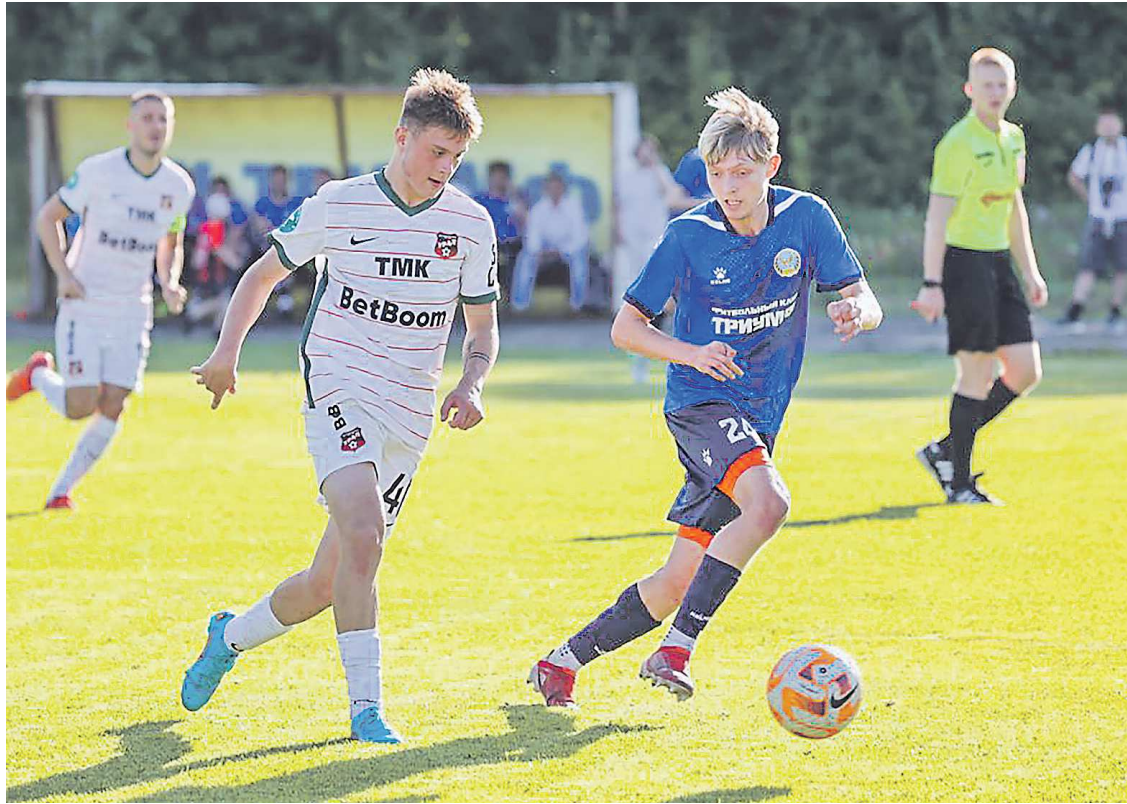
Футболисты «Урала» сумели добиться в Алапаевске главного: подарили болельщикам праздник футбола

– В Свердловской области любят футбол, активно болеют за него, – сказал перед матчем в Алапаевске региональный министр физической культуры