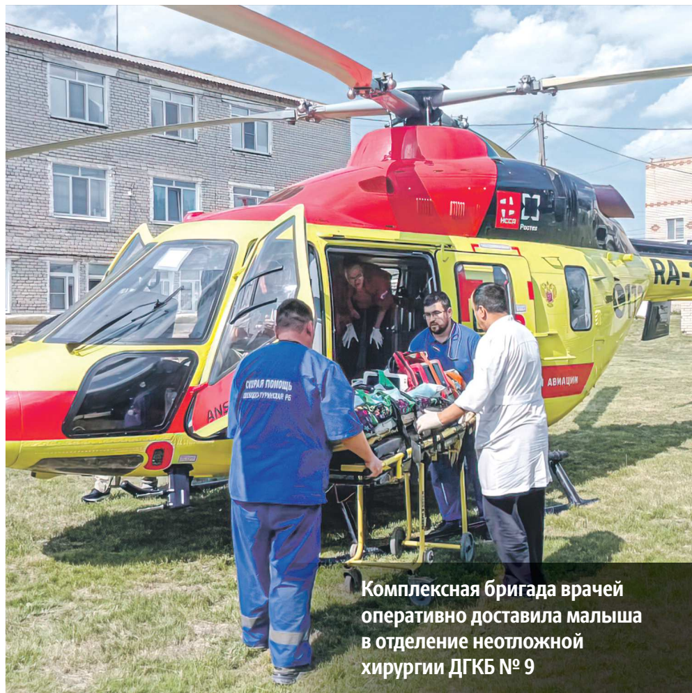
Комплексная бригада врачей оперативно доставила малыша в отделение неотложной хирургии ДГКБ № 9

Операция прошла успешно. После стабилизации состояния малыша его эвакуировали авиабригадой ТЦМК в отделение неотложной хирургии ДГКБ № 9, где лечение продолжилось. Сегодня он уже дома.