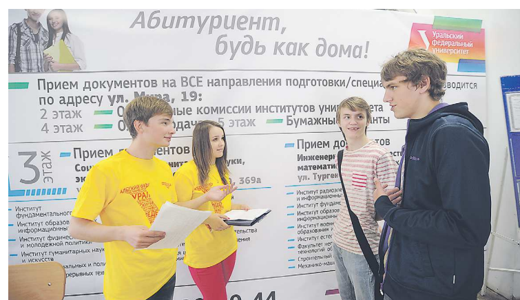
В 2023 г. с начала приемной кампании абитуриенты уже подали в УрФУ 2,5 тыс. заявлений, в то время как год назад эта цифра составляла 2,1 тыс.

Рейтинг составлен на основе данных сервиса госуслуг «Поступление в вуз онлайн»